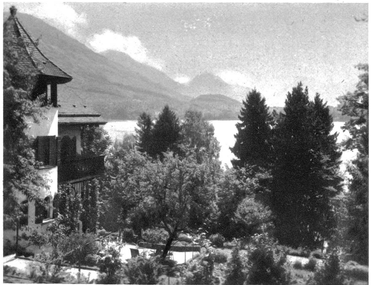
Heim des Dichters am Vierwaldstättersee