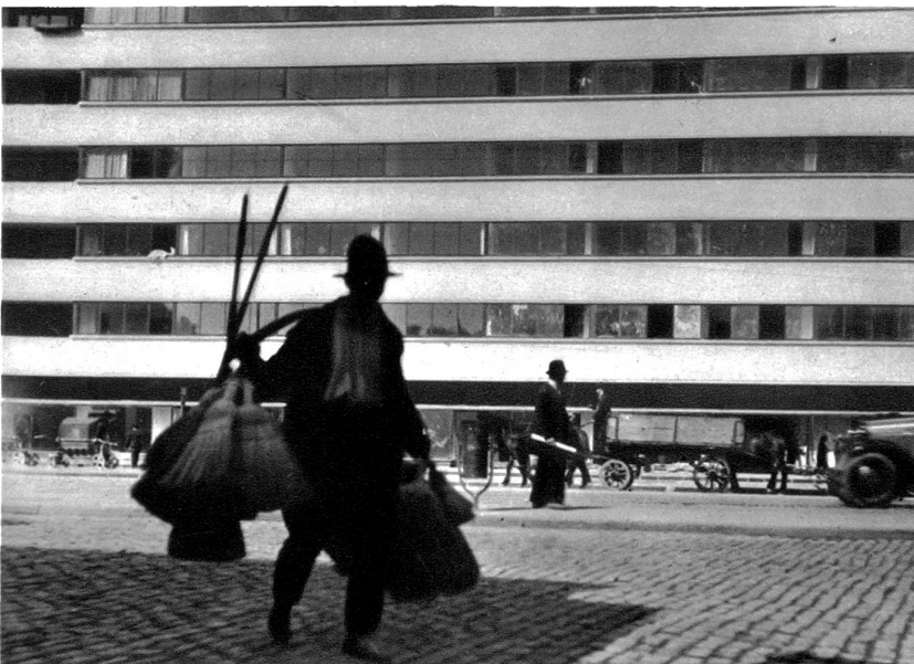
Der Besenhändler im neuen Viertel. Ob er seine Ware nicht bald mit Staubsaugern auswechseln wird?