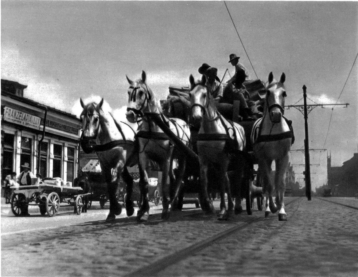
In hellem Trab kommen solche Vierspänner daher