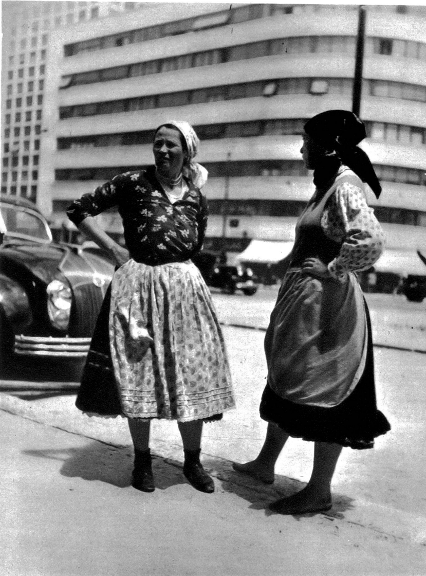
Rumänische Bauernfrauen, deren Männer in Neubauten beschäftigt sind, warten auf den Arbeitsschluss auf den Bauten.