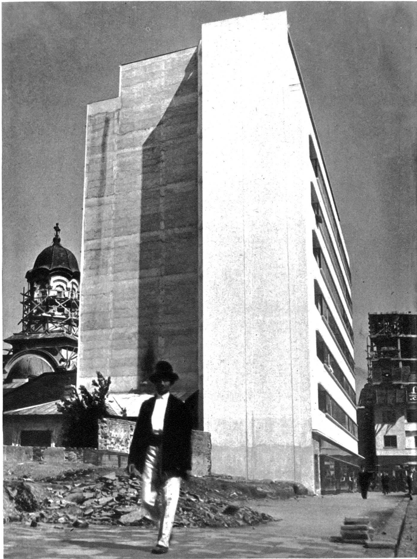
Der alte und neue Baustil begrüßen einander