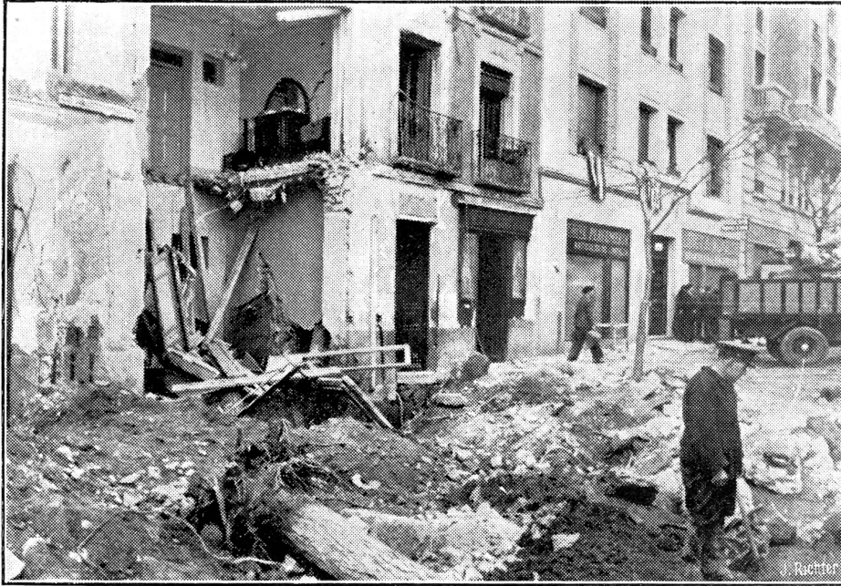
Die Zerstörungen um Madrid greifen um sich.

haarlein berichten. Und überdies kann ja Berlin in London erzählen, wie es Mussolini durch seinen Herrn Grandi auch erzählen ließ, an den Abmachungen mit Franco sei kein wahres Wort; Deutschland denke nicht an die Beerbung Spaniens bei lebendigem Leibe, trachte nach keinem Fesseln spanischer Kolonialerde! Und vielleicht wird es London glauben! Unterdessen kann man die Flugstationen auf Teneriffa und in Jfni oder Tetuan ausbauen und eines Tages den Briten die Zunge strecken: Vertreibt uns wieder, wenn ihr könnt! Die Vermutung, Mussolini mache es, trotz Mittelmeerabkommen, auf den Balearen genau so, will nicht verstummen.