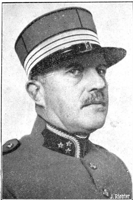
Die Sandschak-Mission beim Völkerbund.

Zum Jahreswechsel ziemt es sich einmal, über die vielkritisierte „Dringlichkeitspolitik“ des Bundesrates in einem Zusammenhang nachzudenken, der gewöhnlich gar nicht beachtet wird. Der Bundesrat hat gewiß kein verfassungsmäßiges Recht,