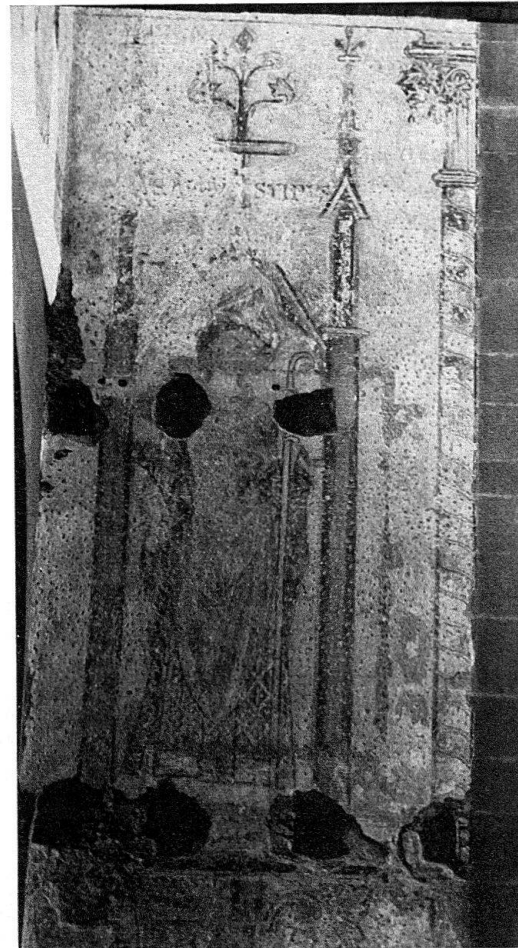
Abb. 2. Konstanz. Insel-Hotel, ehemalige Dominikanerkirche. Südflügel

Die ebenfalls großfigurig bemalte Triumphbogenwand 7 , von der nur rotgrundige Blattrankenansätze in den Zwickeln erhalten sind, muß bis zu ihrer Zerstörung vor 1875 ein großartiges Gegenüber zur Westwand gewesen sein. Wenn in der Konstanzer Dominikanerkirche wie üblich die Ausmalung im Chor und an der Triumphbogenwand begonnen hat, wird die Westwandbemalung zuletzt entstanden sein. Diese über 12 m hohe bemalte Fläche ist nur schlecht im Ganzen zu photographieren, weil die eingezogenen Hotelstockwerke bereits am zweiten Obergadenjoch von Westen beginnen, während der Beschauer die ganze Wand unverkürzt mit dem Auge erfaßt. Es sei hier das Verständnis des Eigentümers Baden-Württemberg – Land- und der Hotelgesellschaft hervorgehoben, die das Vestibül, das heißt die vier westlichen Joche, nur durch eine Glaswand vom Saal trennen wollen, so daß das 40 m lange Mittelschiff weiterhin im Ganzen gesehen werden kann. Die Westwand wird dadurch auch künftig in größerem Abstand zu sehen und für den Saal in ihrer wohl abgewogenen Farbigkeit ein Schmuck sein.