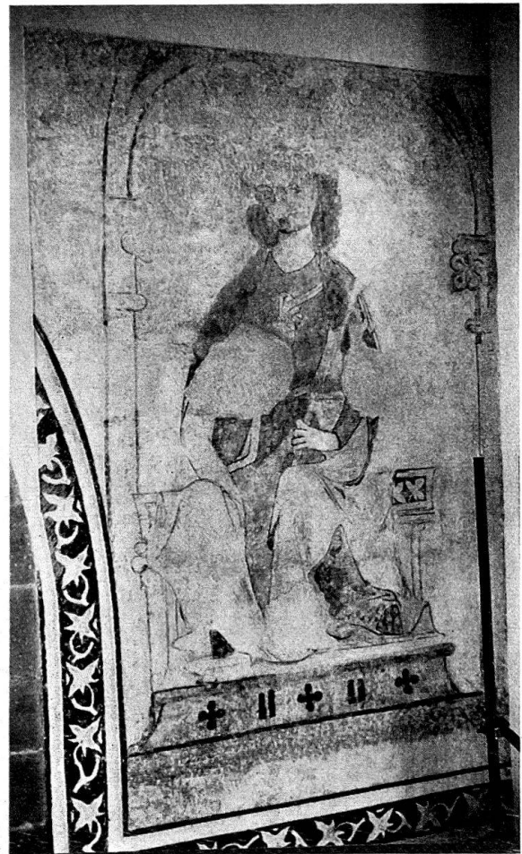
Abb. 4. Konstanz. Insel-Hotel, ehemalige Dominikanerkirche. Fresko an der Westwand, oberer Teil, nördliche Hälfte: Sitzende Figur mit Szepter. Zustand nach der Restaurierung

der Freilegung in Abbildungen gezeigt 9 (Höhe des ganzen Bildes: 4,20 m, Davids: 2,70 m). Nach Entfernen der Reste der zum Schutz stehengelassenen barocken Tüncheschicht, Vorfixieren mit Silikat und Reinigen mit destilliertem Wasser, Einputzen der großen, durch Balken eingestoßenen Löcher und zahlreicher Pickelhiebe und ihrer Eintönung mit Silikatfarbe ist das Bild viel heller, klarer und farbiger intensiver geworden. Allerdings hat sich nach Entfernen von Mörtelresten des Verputzes des ausgehenden 19. Jhs. der Ausdruck der Augen sehr verändert (Abb. 1).