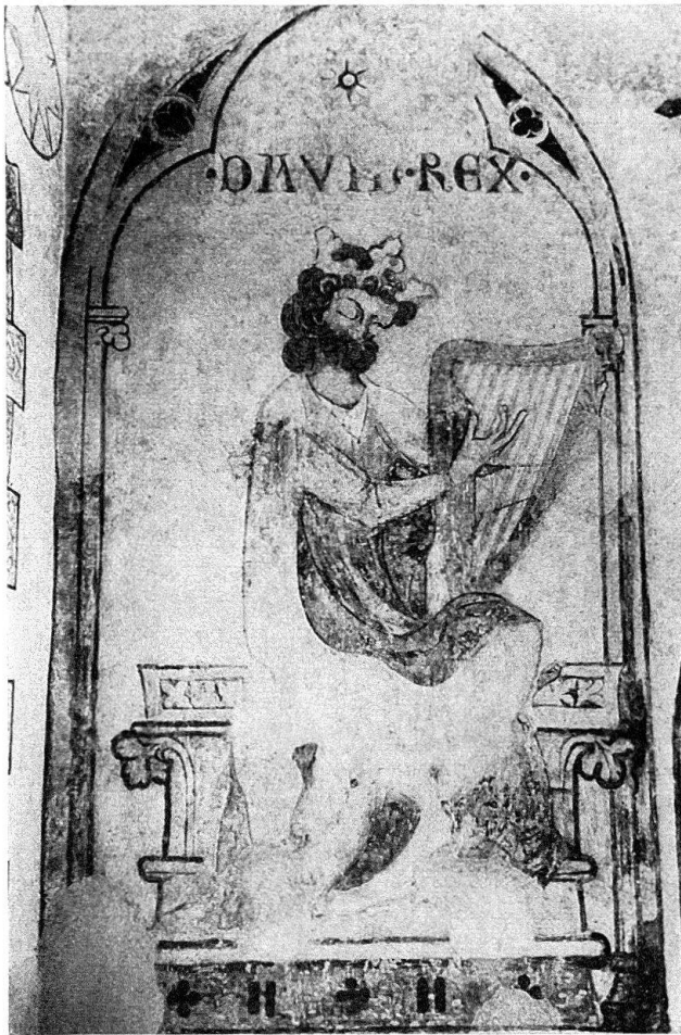
Abb. 1. Konstanz. Insel-Hotel, ehemalige Dominikanerkirche. Fresko an der Westwand: David Rex. Nach der Restaurierung