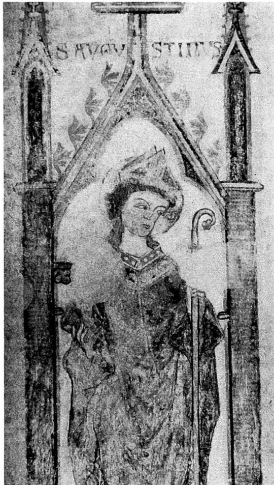
Abb. 3. Konstanz. Insel-Hotel, ehemalige Dominikanerkirche. Fresko an der Westwand: S. Augustinus, Detail. Zustand nach der Restaurierung