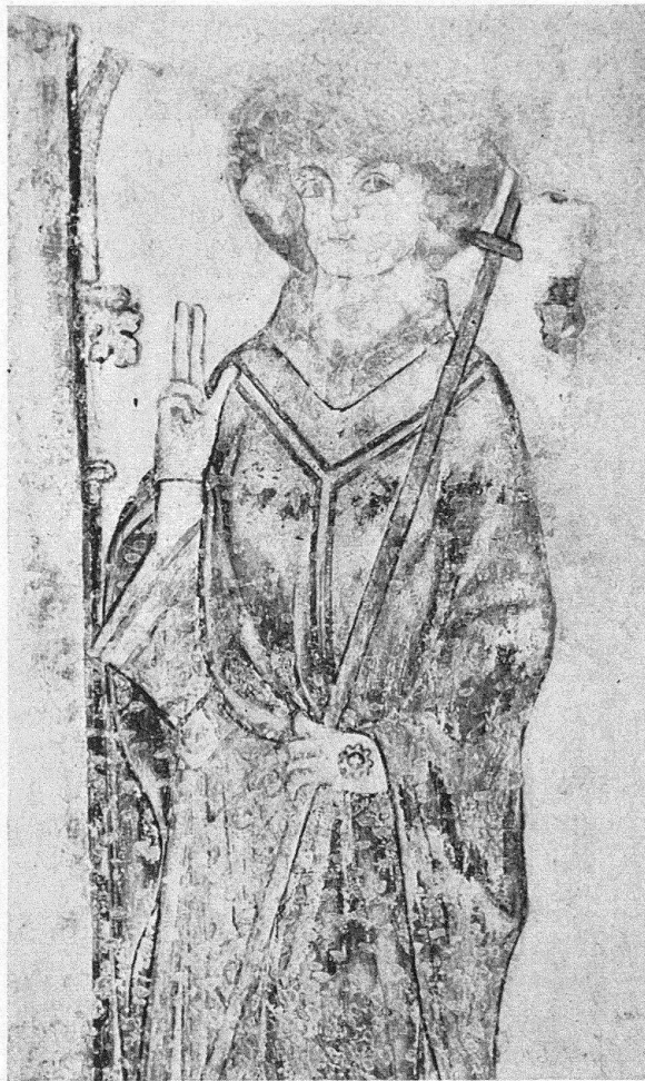
Abb. 6. Konstanz. Insel-Hotel, ehemalige Dominikanerkirche. Fresko an der Westwand, unterer Teil, nördliche Hälfte: (St. Nikolaus?), stehende Heiligenfigur, Detail. Zustand nach der Restaurierung

der Mund sind nicht gestört, hingegen ist die Nase des Heiligen durch die dort unebene Oberfläche entstellt (Abb. 3).