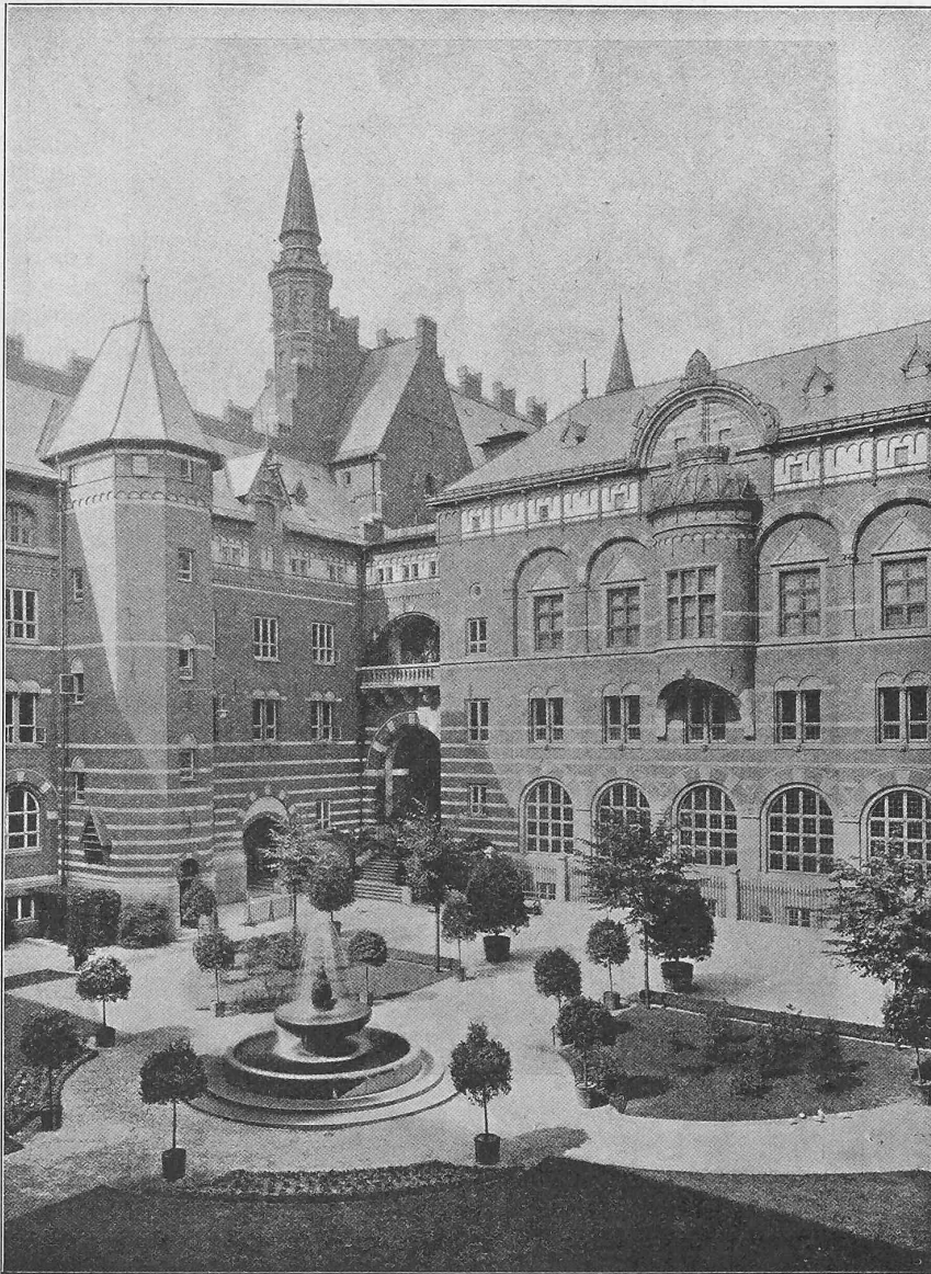
Abb. 2. Blick in den offenen Hof. (Nach «Beispiele angewandter Kunst», vergl. S. 203.)