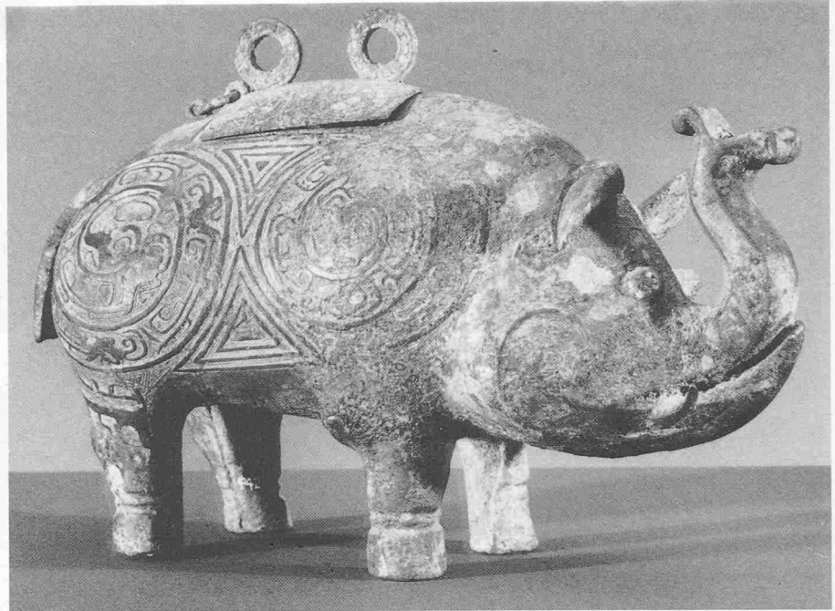
Zun in Gestalt eines Elefanten, westliche Zhou-Dynastie, 10. Jahrhundert v. Chr., Bronze