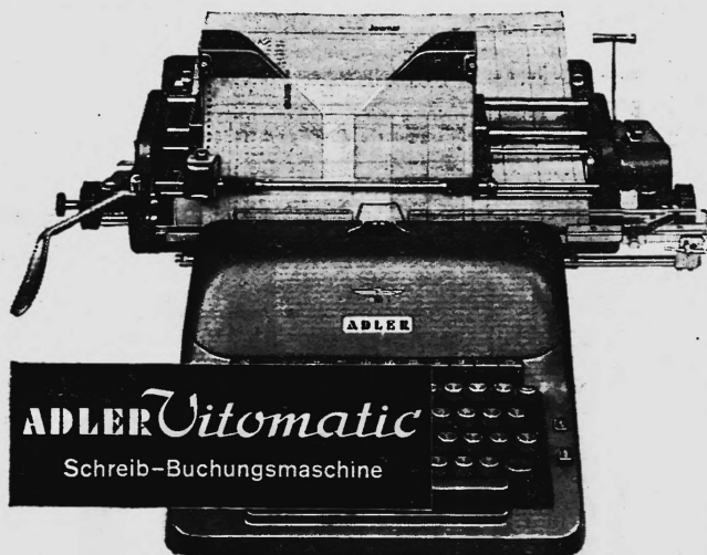
ADLER Vitomatic Schreib-Buchungsmaschine

Mit verbundenen Augen können Sie die Kontenkarte schreibfertig, zeilengerade und auf die richtige Buchungszeile einstellen. Kein Richten — ein Hebelzug genügt!