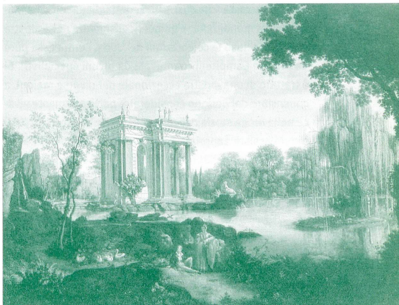
Giovanni Campovecchio (attribuito), Veduta del Tempio di Esculapio nel Giardino del lago di Villa Borghese , fine XVIII secolo, olio su tela, Collezione privata.

Il complesso, Casino e giardini, conosce una nuova, fondamentale fase di rinnovamento e ampliamento tra gli ultimi