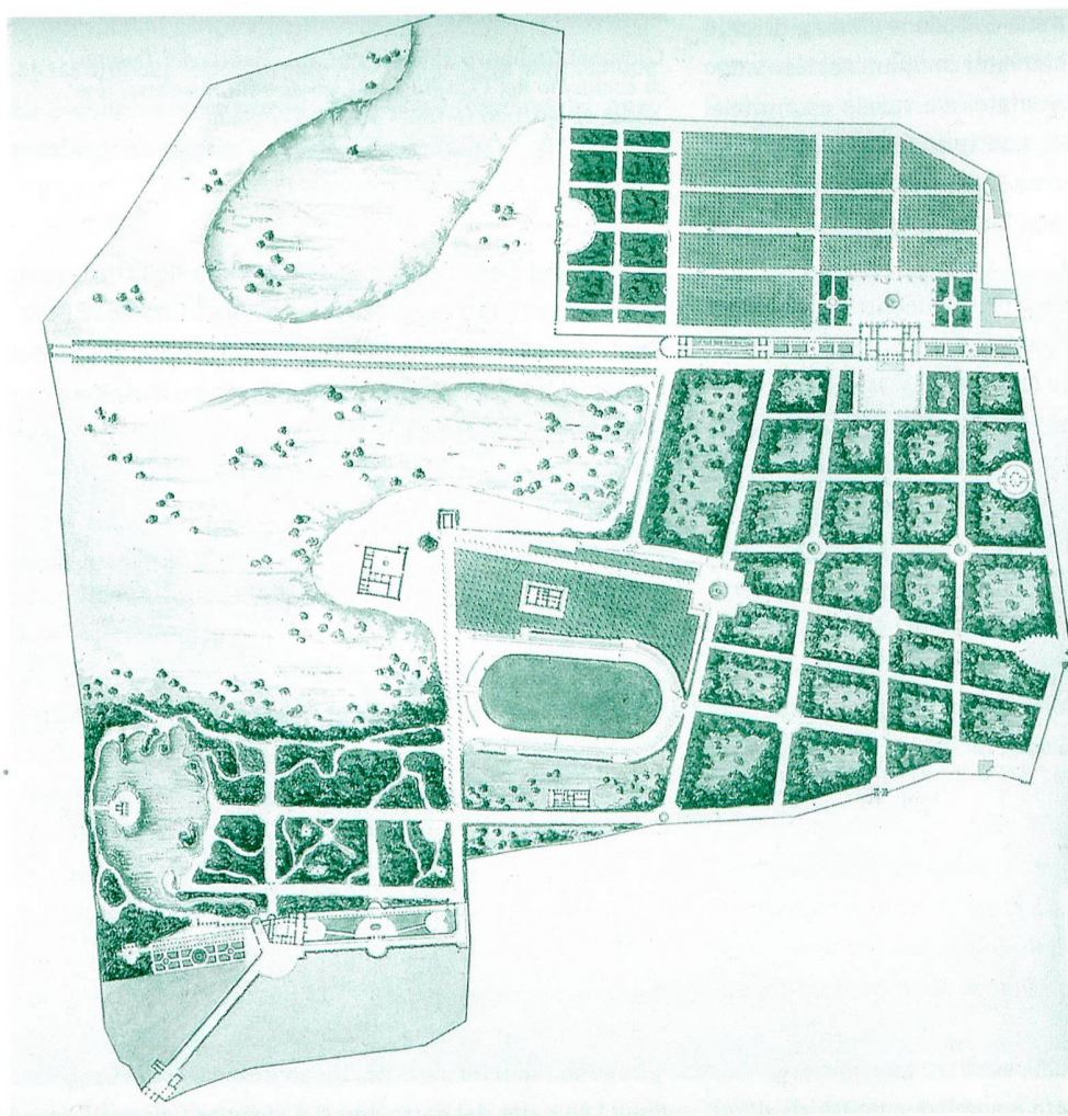
Charles Percier e Pierre-François-Léonard Fontaine, Pianta di Villa Borghese , inchiostro di china, penna e acquerello su carta, 1809, Roma, Museo di Roma.

percorso del muro torto, e la costruzione di un nuovo monumentale ingresso su via Flaminia, punto di approdo in città per chi arriva da nord, in quegli anni nobilitato con la discesa del Pincio a piazza del Popolo, ideata dal Valadier. Eccezionali per qualità e rarità molti dei materiali esposti, alcuni inediti, altri, come le colossali sculture di Gabii prestate dal Louvre, rientrati per la prima volta in Italia dopo l'acquisizione da parte di Napoleone. Interessante e nuovo il taglio dato alla rassegna, che ha privilegiato, con una splendida serie di ritratti, costumi e altri oggetti d'uso, i protagonisti, dai committenti e le loro consorti agli artisti,