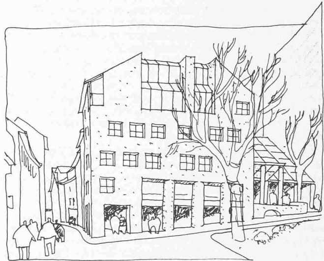
Ansicht von der Rämistrasse