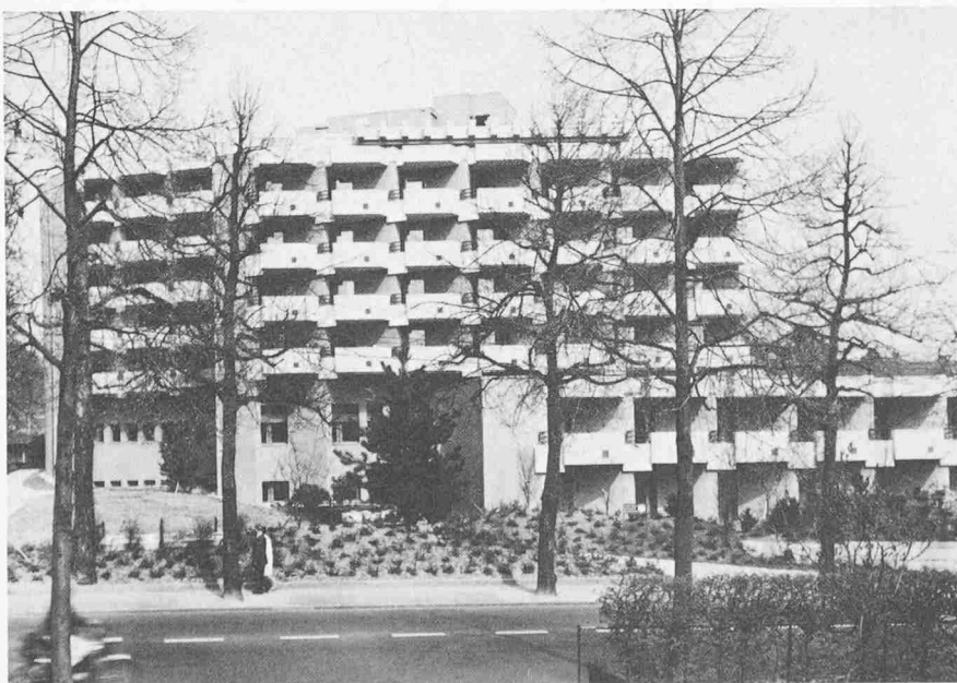
Unten: Ansicht von Südwesten; unten rechts: Teilansicht von Süden