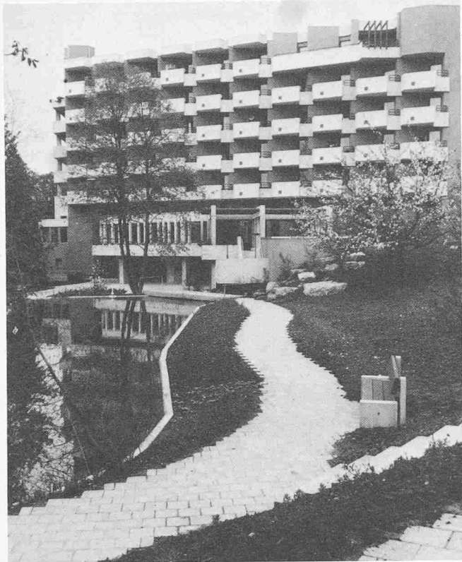
Ansicht von Nordosten

und eignet sich auch für besondere Anlässe. Die weiteren Aktivitäten der Bewohner finden im Therapie- und Bastelraum sowie in der Cafeteria statt.