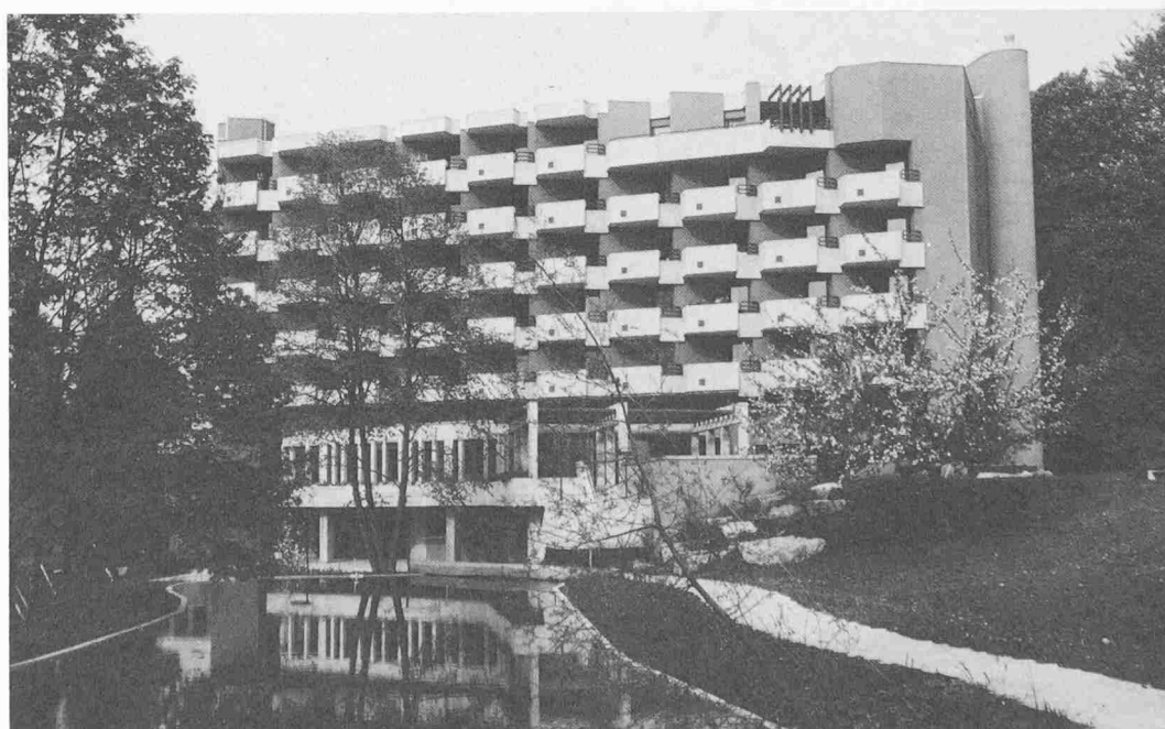
Altersheim Rosental in Winterthur, Ansicht von Nordosten, Haupttrakt mit Speisesaal und Terrasse