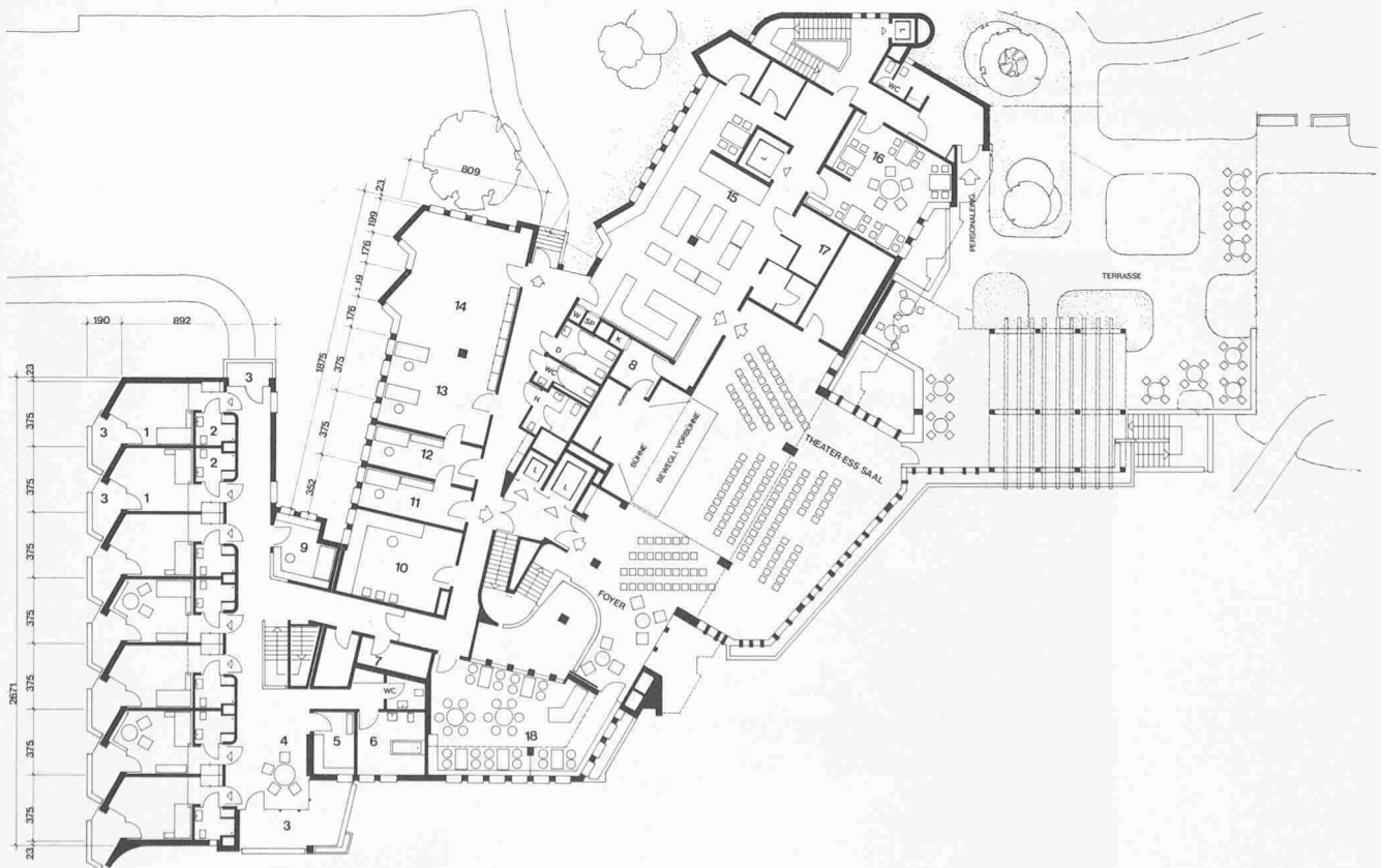
Grundriss 1. Obergeschoss 1:450. 1 Zimmer, 2 Dusche/WC, 3 Balkon, 4 Aufenthalt, 5 Teeküche, 6 Bad allgemein, 7 Wäsche, 8 Econom, 9 Dienstzimmer, 10 Coiffeur, 11 Büro, 12 Geräte, 13 Ergotherapie, 14 Gymnastik, 15 Küche, 16 Aufenthalt, 17 Kühlraum, 18 Cafeteria