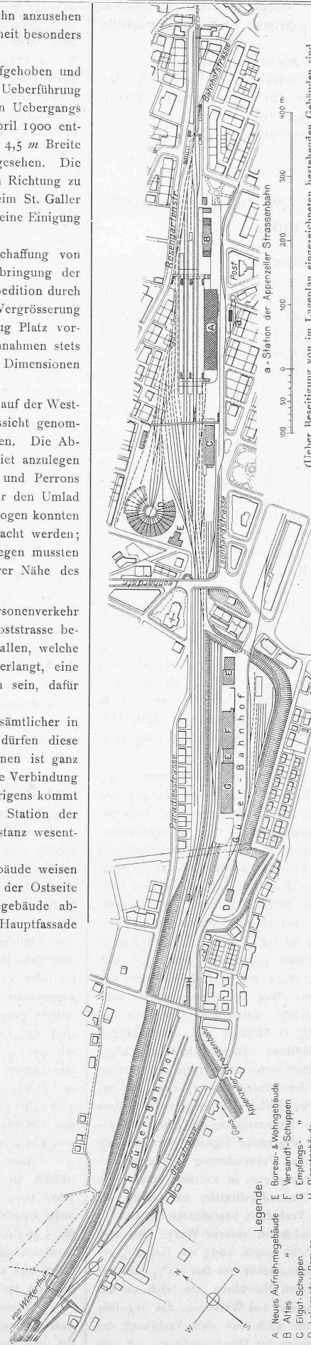
(Ueber Beseitigung von im Lageplan eingezeichneten bestehenden Gebäuden sind Verhandlungen in Aussicht.)