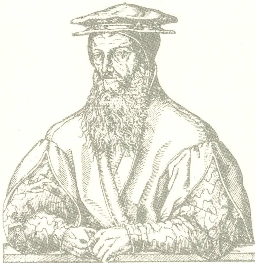
Conrad Gessner 1516–1565

Swiss Journal of the History of Medicine and Sciences Vol. 59 (2002) N° 1/2