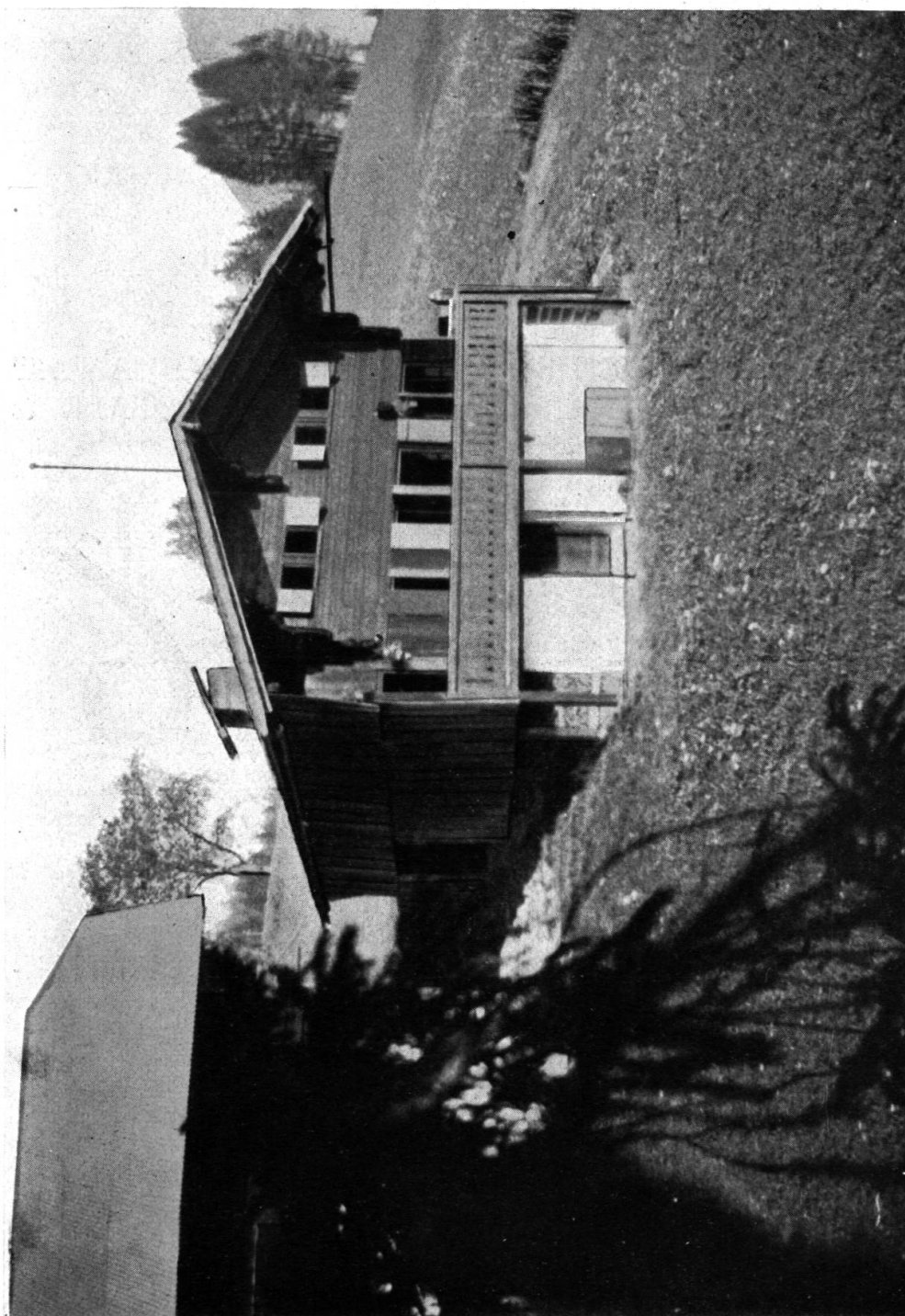
Fig. 33. Au Chabloz s. Les Moulins. 1696. (Maison ne portant aucune indication autre, qu'une date intéressante; voir fig. 32, page 172.)