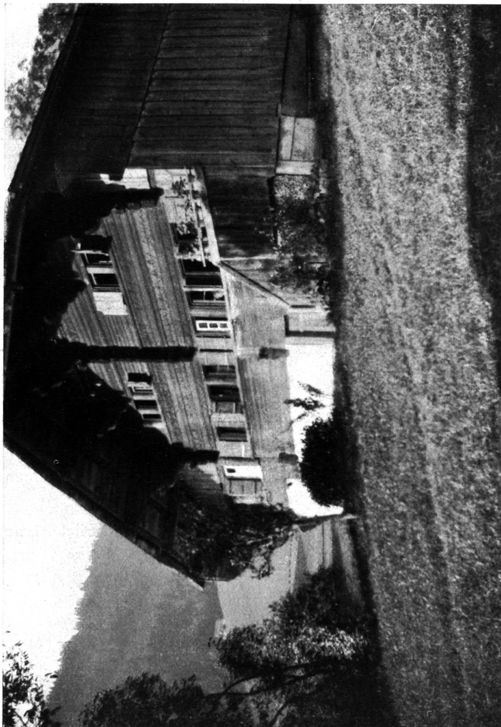
Fig. 35. Aux Tremblays s. Les Moulins. 1718. (Voir page 173.)