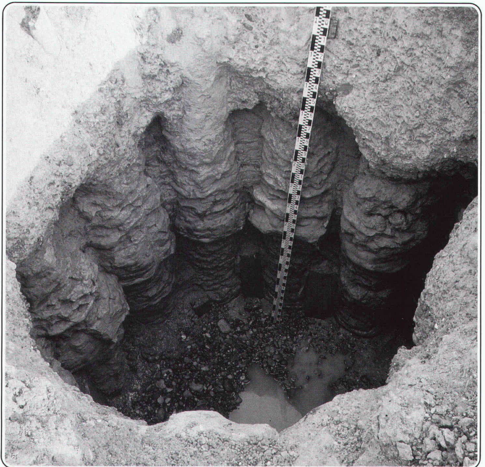
Sicherheit und Wirtschaftlichkeit dank speziell konzipierter Geräte