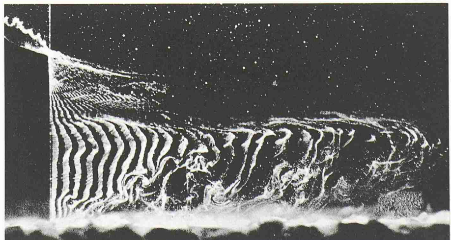
Bild 4. Wasserstoffblasen zeichnen das Geschwindigkeitsprofil eines Dichtestromes von Salzwasser über einer rauhen Sohle. Die weissen Bänder von Wasserstoffblasen werden durch einen pulsierenden Strom über Elektrolyse an einem senkrechten Draht erzeugt