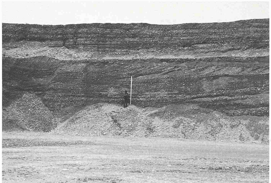
Bild 2. An der Wand einer Kiesgrube werden die Inhomogenitäten der Grundwasserträger aufgeschlossen