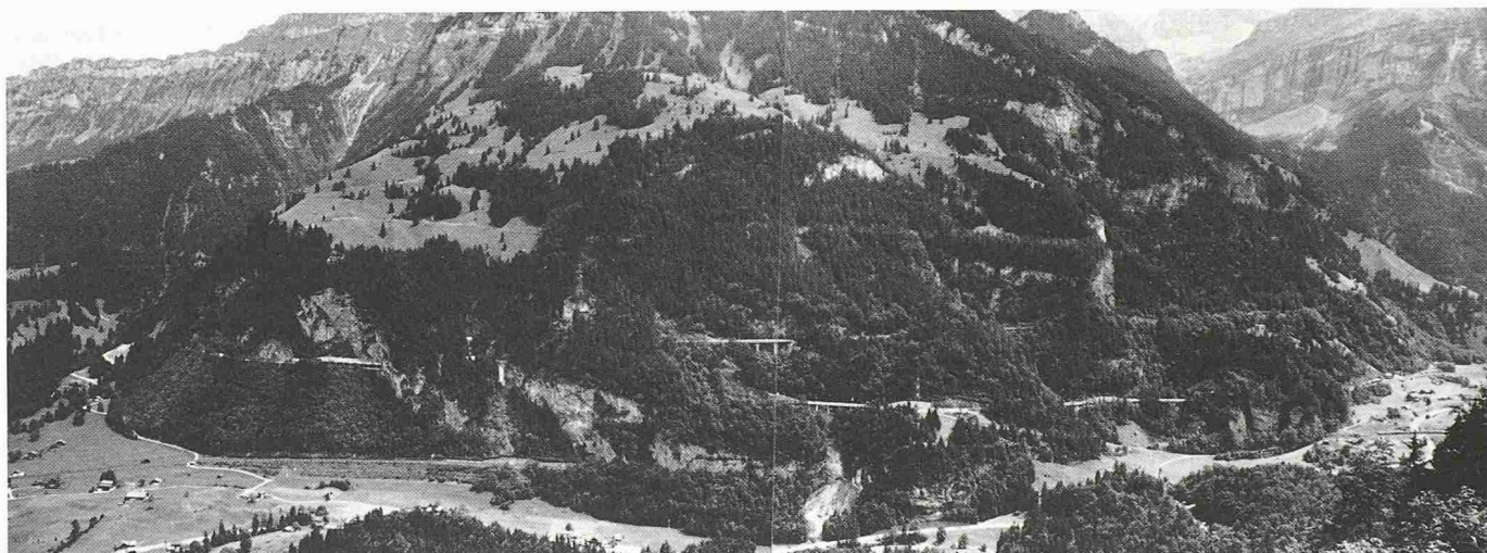
Bild 2. Die fertiggestellte Doppelspur auf der Nordrampe kurz vor der Betriebsübergabe 1988

günstigeres Licht rücken. Wenn die Totlast nicht bergauf und bergab geschleppt werden muss, fällt das Gewicht energieverbrauchsmässig auf der Eisenbahn nicht so stark in Betracht. Eindeutiger Vorteil sind die relativ kleinen Verlade- und Entladestationen und der geringe technische und organisatorische Aufwand an den Terminals. Unbefriedigend sind zurzeit noch die grossen Unterhaltsaufwendungen an den für den Huckepackverkehr eingesetzten Niederflurwagen mit den kleinen Rädern, die auch die Gleisanlagen sehr stark beanspruchen. Für ein längerfristiges Huckepacktransportsystem müssen deshalb Wagen mit weniger gedrängten Konstruktionen und grösseren Rädern eingesetzt werden können, die ihrerseits wiederum Lichtraumverhältnisse beanspruchen, wie sie bei den herkömmlichen Eisenbahntunnel nicht vorhanden sind.