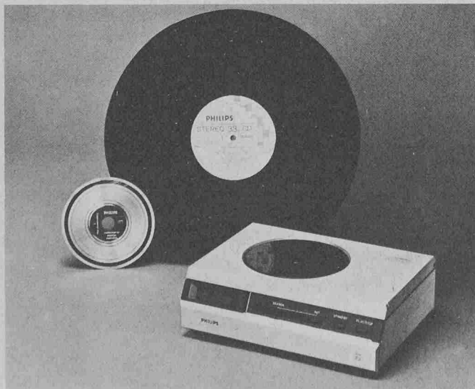
compact disc im Vergleich mit 30-cm-Langspielplatte. Links die neue 11,5-cm-Platte deren digitalcodierter Inhalt mit einem Laserstrahl abgelesen wird. Rechts das sehr kompakte Abspielgerät.

ben in der Tiefe ermitteln und diese auf einer klar lesbaren Skala ersichtlich machen. Das Instrument erfasst Flächen und nicht Punkte. Der Feuchtigkeitsgehalt kann sofort von der Skala abgelesen werden. Das Gerät ist besonders geeignet für Feuchtigkeitsmessungen an anorganischen Baumaterialien (Beton, Backstein, Naturstein, Putz usw.). Es lässt sich aber auch einstellen für die Feuchtigkeitsmessung organischer Materialien, wie Holz, Papier usw. Ein weiteres Merkmal ist das akustische Signal, das den Einsatz in vollständiger Dunkelheit erlaubt. Je nach Einstellung wird dabei vom Instrument ab einem gewissen Feuchtigkeitsgehalt ein Summton ausgelöst. Das Gerät ist robust konstruiert und wird in kräftiger Leder-Tragtasche geliefert, mit deutscher oder französischer Bedienungsanleitung im Deckel. Anderegg Mauerentfeuchtung, 9011 St. Gallen.