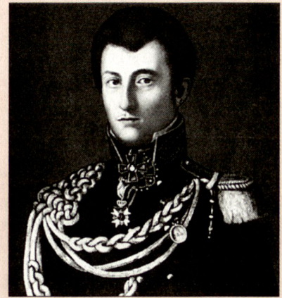
General Carl v. Clausewitz, Stabschef in verschiedenen Verwendungen in Preussen und Russland (hier in russischer Uniform). Klassiker unter den Militärdenkern.

Napoleon überdehnte seine Nachschubwege und musste sich schliesslich aus Moskau zurückziehen. Der Russlandfeldzug kostete ihn eine ganze Armee von über