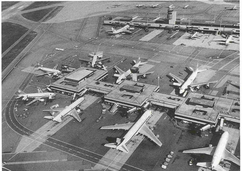
Auf den europäischen Flughäfen (hier Zürich-Kloten) werden ab Ende 1989 nur noch Flugzeuge landen dürfen, die den strengen ICAO-Lärmschutz-Richtlinien entsprechen

Welche eindrucksvollen Fortschritte im Kampf gegen den Lärm in den letzten Jahren dank umweltfreundlicherer Mantelstromtriebwerke und verbesser-