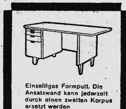
Einselliges Formpult. Die Answand kann jederzeit durch einen zeitlosen Korpus ersetzt werden