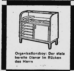
Organisationsboy: Der stets bereite Olenar im Rücken des Herrn