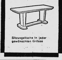
Sitzungsische in jeder gewünschten Grösse

Das Formpult unterscheidet sich von den früher gebräuchlichen Pulten und Schreibtischen durch vollständig neue Linienführung, verbunden mit zeitloser Eleganz und grösster Zweckmässigkeit. Es ist nach einem Spezialverfahren - Hochfrequenzverleimung und Formpressung - hergestellt und hat so ein um 25% geringeres