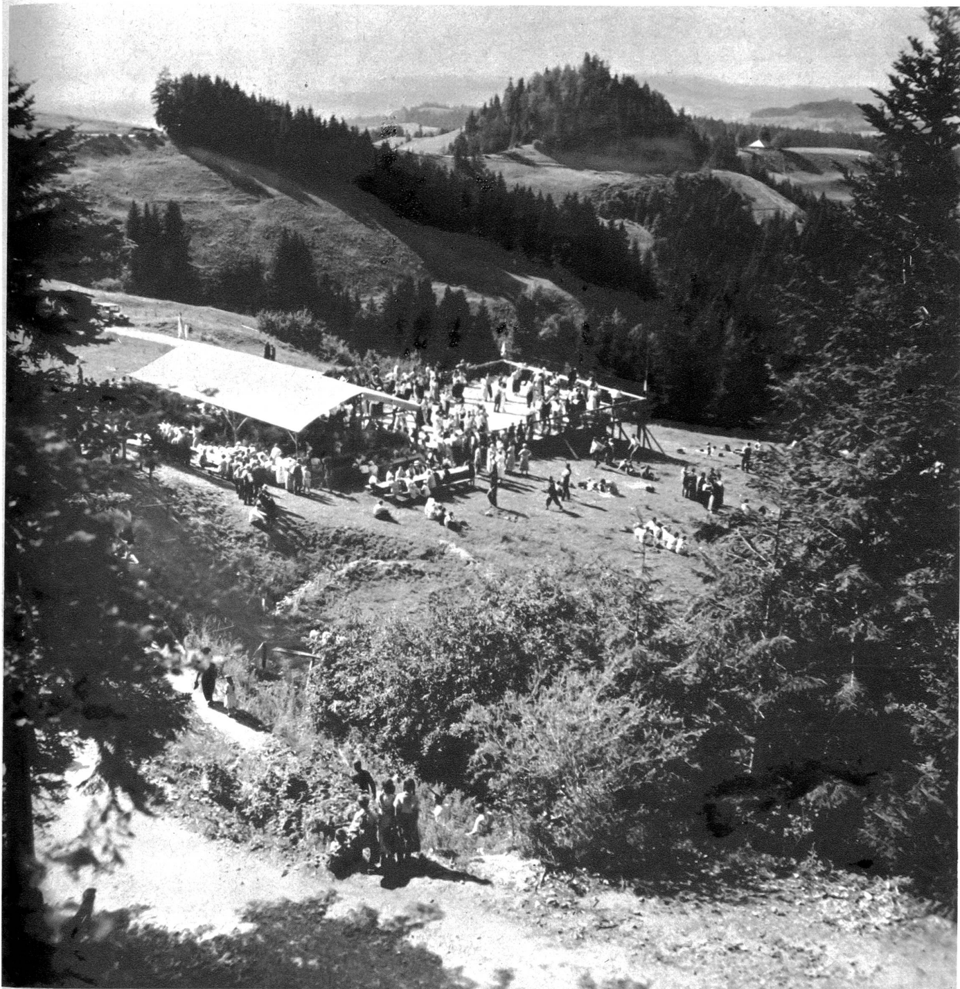
Die schöngelagerte Lüderalp eignet sich bestens für die Chilbi