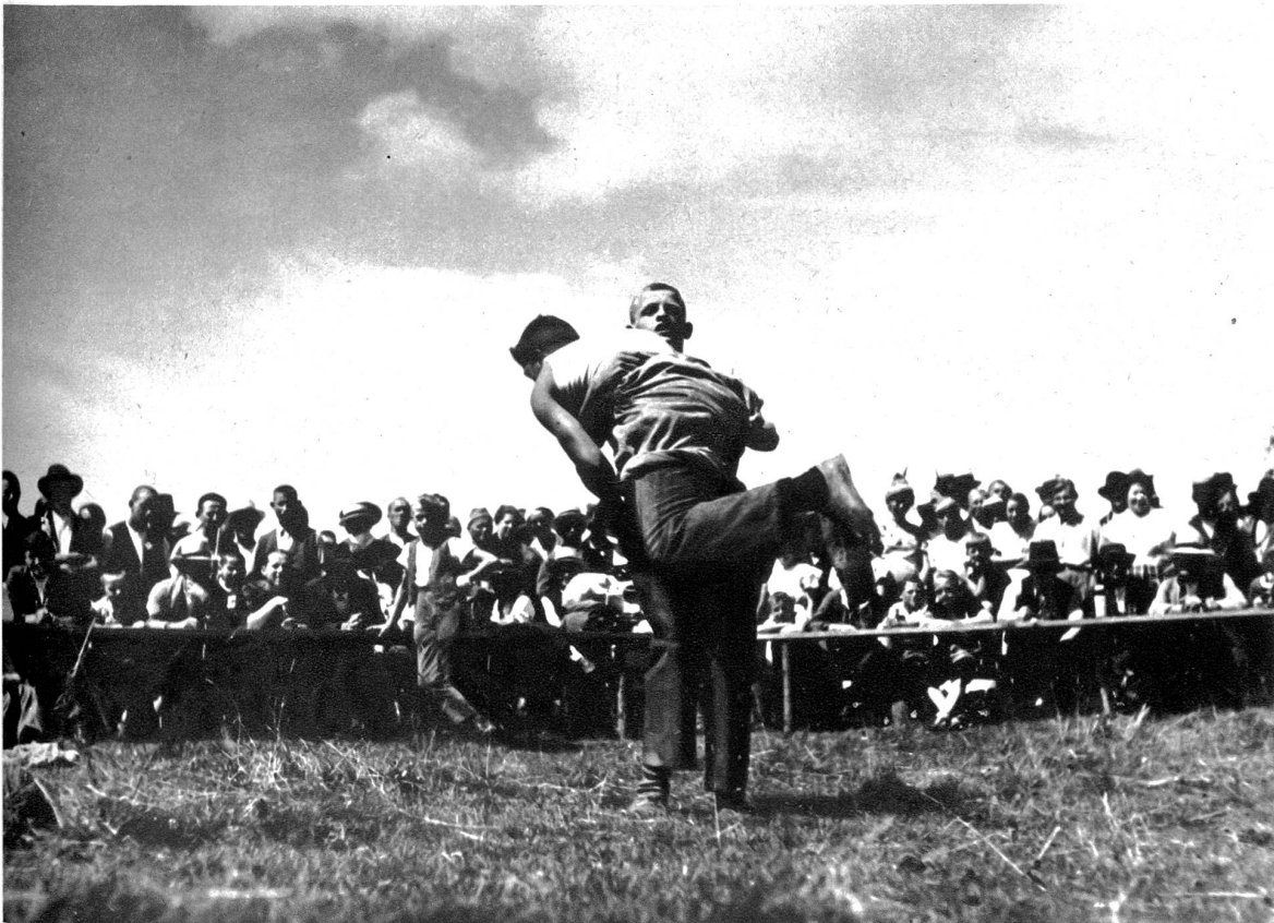
Kraftstrotzend ha- ben sie einander gepackt. Nicht nur bei der Tagesar- beit, sondern auch hier gilt es sich zu rühren