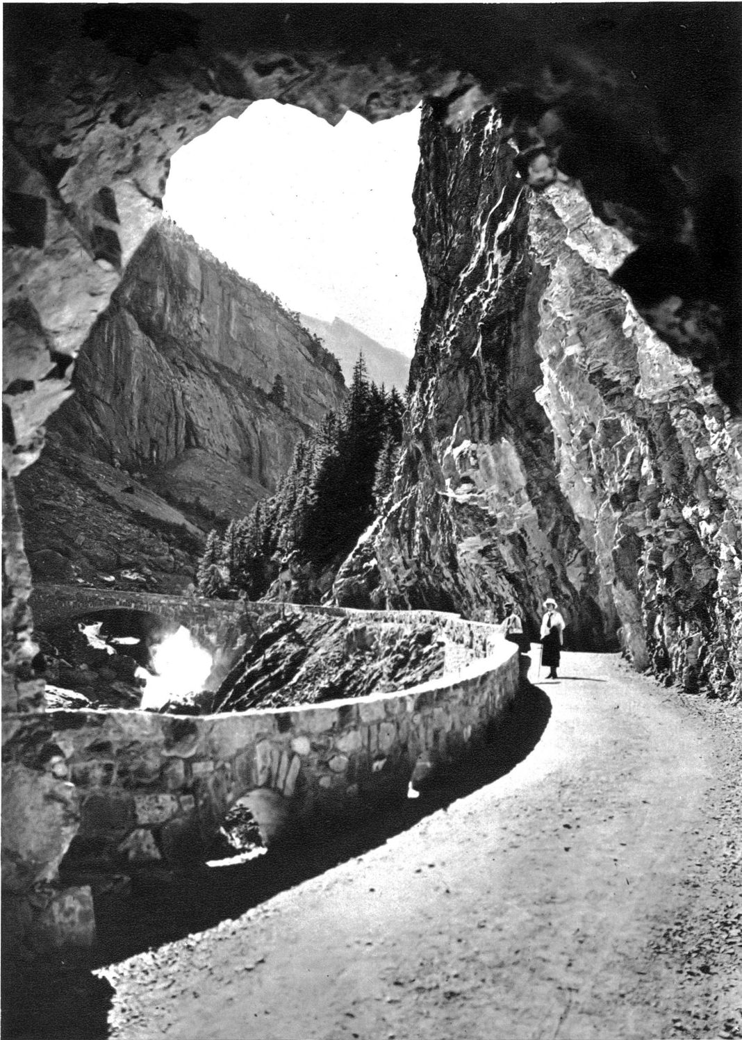
Strasse ins Gasterntal nach Kandersteg

und gewinnen den Felsen auf der Ostseite, wo wir stellenweise den alten römischen, im Granit der Flühe ausgehauenen Saumweg begehen können, und wir gelangen nach weitem zwei Stunden auf die Paßhöhe (2681 m), allwo sich gegen Süden zu eine großartige Fernsicht in die Walliser Alpen öffnet. Das prächtige Bietschhorn, der schönste Berg des Rhonetales, ist dem Auge in nächste Nähe gerückt. Wir können auch in zwei Stunden auf das Hockenhorn (3257 m) hinaufsteigen und die Fernsicht von dort oben genießen. Der Abstieg vom Paß nach Löttschen führt in südöstlicher Richtung über den Stierstuf auf die Kummernalp und über die Bergwiesen von Schällbett und Martinsbühl in zwei Stunden nach Rippel, sodas der Ueber-