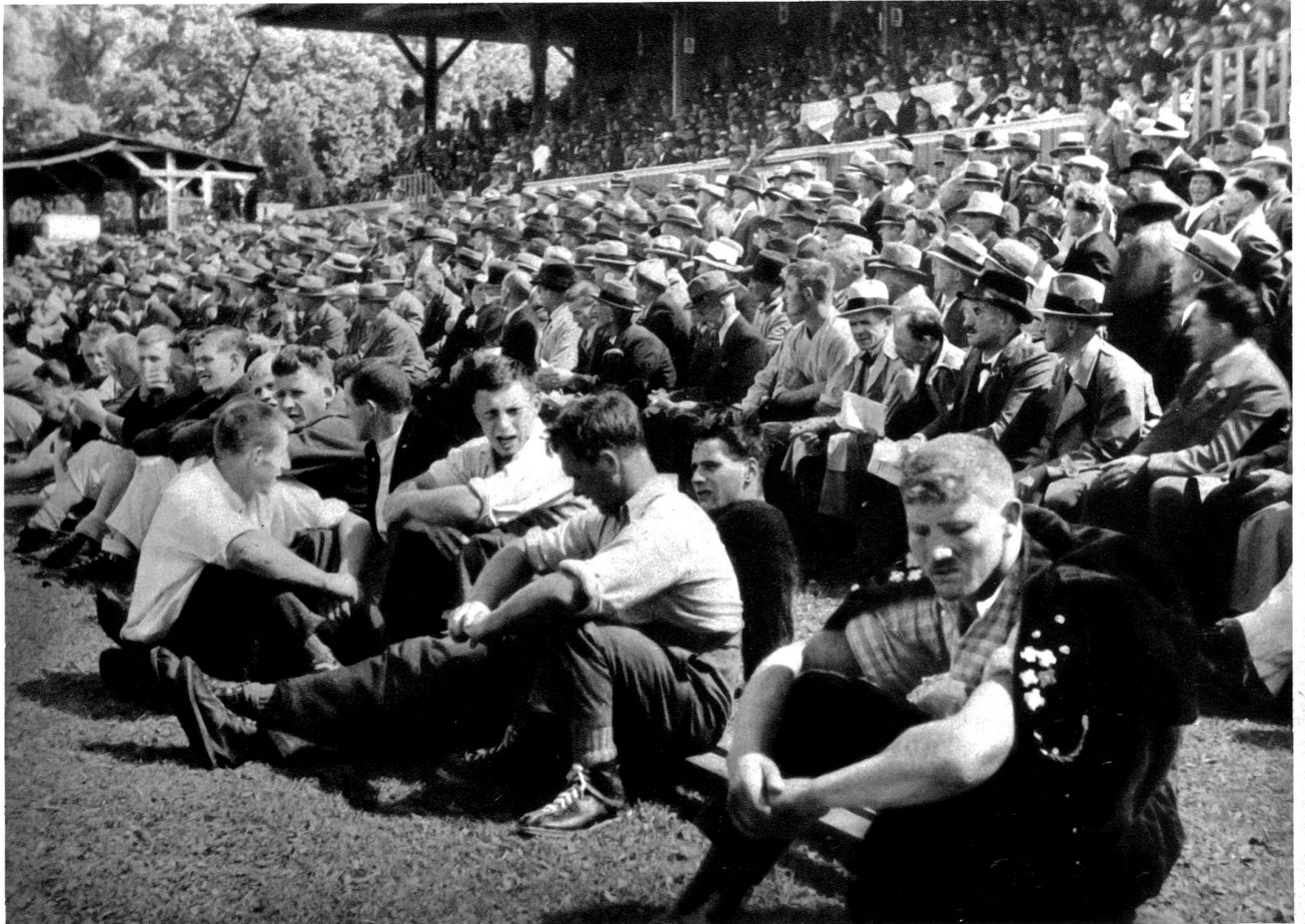
Die stattliche Schwingergemeinde vor der Tribüne während dem Ausstich