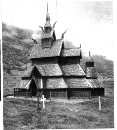
Stabkirche beim Sognefjord

die Titanenfront himmelragenden Gebirges, wo mit bobrenden Jungen der Degen Hunderte von Kilometern tief keine 2000 Meter freien Fjorde ausstrah, wo rauschende Gletschbäche von blauen Gletschern und schneeweißen Firnen flürzen; wo die Nordlandblume aus der feuchten Luft ihre märchenhaften Schleier webt, wo grüne Matten, blumenüberfüllt, und herrliche Abteilungen Meer und Hochgebirge verbinden; wo im Schutze der vom Gletscherrausch rundgeschiffenen Schären Stadt und Fischerdorf arbeitfam sich reihen, von der Erhabenheit der Natur