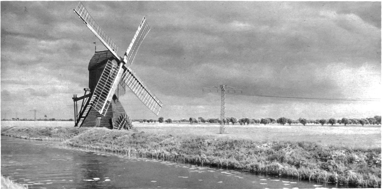
Charakteristische Umgebung Danzigs

portoben, die deine königliche Höhe doch nicht erreichten. — Sahst dann neues Blühen und neues Leben, warst der stolze Zeuge eines herrlichen Aufstieges — und heute — ? Es ist das alte Danzig nicht mehr, auf das du blickst. Ein neues ist an seine Stelle getreten. Fremde Trachten, fremde Bauten mischen sich in die alten, heimischen. Aber eins kann man von Danzig sagen: Wie die Zeiten auch wechselten, wie die Stürme über das trugige Haupt von St. Marien auch dahibrausten, in ihrem Kern und Wesen blieb die alte Hansastadt immer treu, trotz dem Frieden von Versailles, trotz der Loslösung von Ostpreußen von Deutschland. Auch das ist nichts Neues. Wie überhaupt nichts Neues unter der Sonne geschieht und alles nur ewige Wiederholung und auch die Geschichte der Völker nichts ist als fließendes Gleichnis. Das ist das ausgleichende Gesetz allen Geschehens und Leidens.