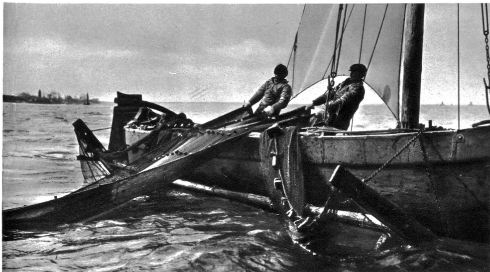
Fischer beim Einziehen der Netze

Spitz wie eine Nadel glüht der goldverbrämte Rathhausturm in den geheimnisvoll blauenden Himmel wie ein stiller Fingerzeig in Fernen, die man nur suchen und ahnen kann, in das Sehnsucht weckende Land der Ewigkeit. Unter ihm streckt sich der schöne Bau