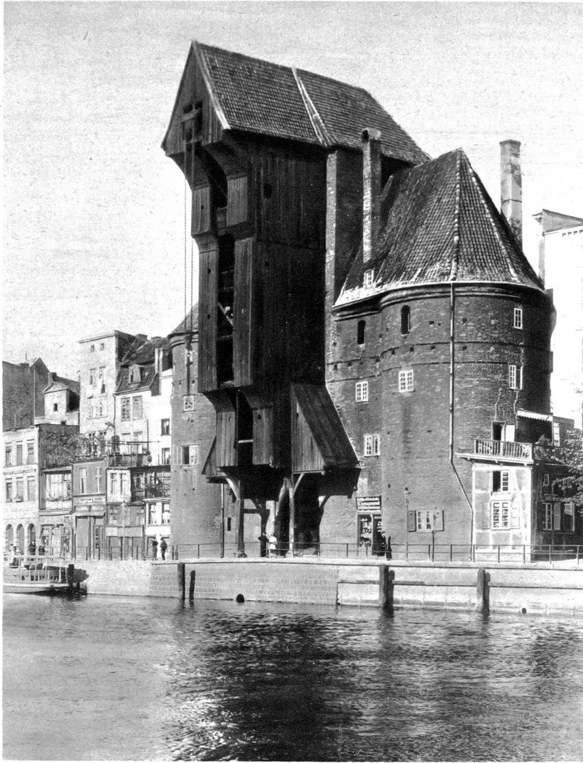
Das Kranter in Danzig

des Rathauses, fein gemeißelte Spitzbogen zeigen ihr wundervolles Gewebe, um den alten Neptunbrunnen schwirren und girren Tauben, vornehmer Miene blickt der Artushof auf sie herab. Gedenkt er der Zeiten, da er die Gäste der blühenden Hanfsstadt in seinen kunstgeschmückten Hallen sammelte? Da Fürsten und Könige über seine Schwelle schritten und er Feste sah, wie sie nur in einer alten deutschen Hanfsstadt möglich waren? Bleibe holder Traum! — Und was sagst du nun zu alledem, du wunderlicher Geselle, du altehrwürdiger Recke, der du wie ein Riese aus verflungener Zeit plötzlich dein stolzes Haupt über all die Giebel und Türme hinweg erhebst und zu mir herunterschaut mit einem Blick, in dem so viel Wehmut und so viel Größe ist, so viel Leid und so viel Stärke zugleich, du unvergleichlicher Turm der alten Oberpfarrkirche zu St. Marien? Gefällt es dir in der Zeit nicht mehr, in der wir leben? Pakt dich auch die heiße, die unbezwingliche Sehnsucht nach Tagen, die einmal waren und jetzt so weit, so weit hinter uns liegen?