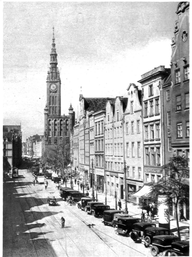
Langermarkt mit Rathaus in Danzig

portoben, die deine königliche Höhe doch nicht erreichten. — Sahst dann neues Blühen und neues Leben, warst der stolze Zeuge eines herrlichen Aufstieges — und heute — ? Es ist das alte Danzig nicht mehr, auf das du blickst. Ein neues ist an seine Stelle getreten. Fremde Trachten, fremde Bauten mischen sich in die alten, heimischen. Aber eins kann man von Danzig sagen: Wie die Zeiten auch wechselten, wie die Stürme über das trugige Haupt von St. Marien auch dahibrausten, in ihrem Kern und Wesen blieb die alte Hansastadt immer treu, trotz dem Frieden von Versailles, trotz der Loslösung von Ostpreußen von Deutschland. Auch das ist nichts Neues. Wie überhaupt nichts Neues unter der Sonne geschieht und alles nur ewige Wiederholung und auch die Geschichte der Völker nichts ist als fließendes Gleichnis. Das ist das ausgleichende Gesetz allen Geschehens und Leidens.