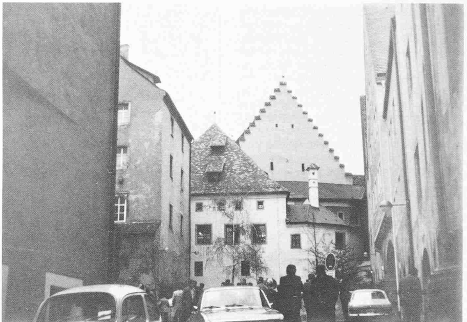
Bild 8. Altstadtsanierung Regensburg

Adresse der Verfasser: Institut für Orts-, Regional- und Landesplanung, Stabsstelle Reusstalforchung und Institut für Kulturtechnik, ETH-Hönggerberg, 8093 Zürich