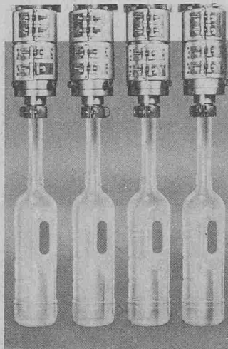
PVC-Getränkeflaschen mit Griff, auf der Bell-Blasformanlage gleichzeitig vierfach hergestellt.

Da die Verarbeitung von PVC mit hohem K-Wert (maximal