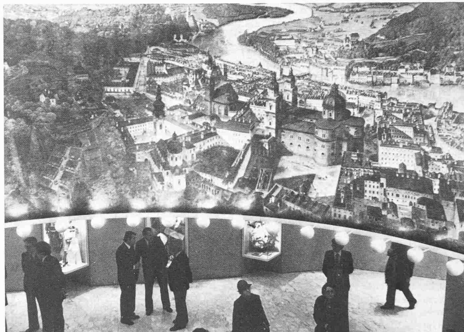
Das «Sattler-Panorama» von 1825, ein prachtvolles Rundgebäude der Stadt Salzburg, wurde in den neuen Bau geschickt integriert

die jedes Ambiente entbehrenden Restaurantsäle des neuen «Winkler».