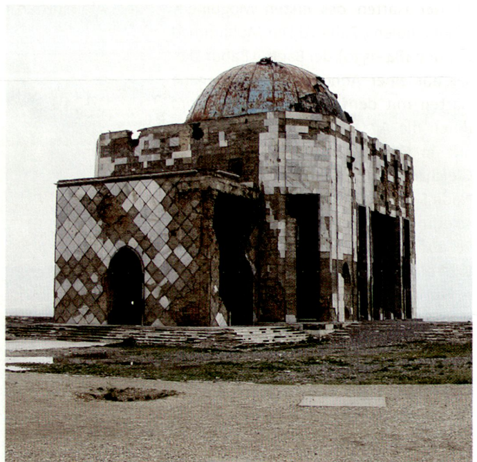
Grabdenkmal von König Nadir Shah.