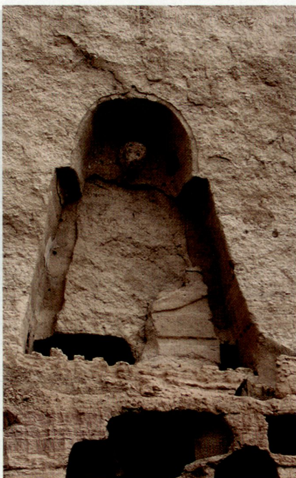
Oben links: Höhle eines mutmasslichen Bodhisattva (Anwärter einer künftigen Buddhaschaft) in Bamjyan.