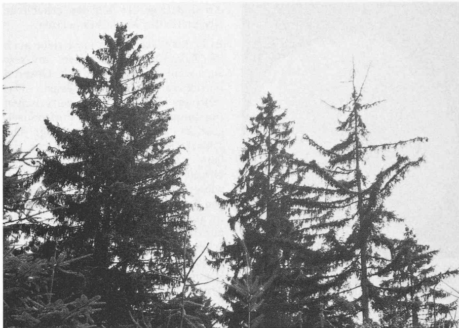
Alle diese Fichten sind geschädigt, die äusserste, hohe rechts ist praktisch tot: dürrer Gipfeltrieb, sehr weitgehender Nadelverlust

Bei den Anstrengungen zur Verminderung der Luftverschmutzung ist jeder, auch der kleinste Anteil, von Bedeutung. In den allernächsten Jahren wird es vor allem darum gehen, die Kurve der Verschmutzungen nicht weiter ansteigen zu lassen. Dabei ist das schon jetzt hörbare Argument, diese oder jene Massnahme bringe nicht viel Reduktion, unannehmbar. Bei jeder denkbaren Massnahme wird im schwerfälligen