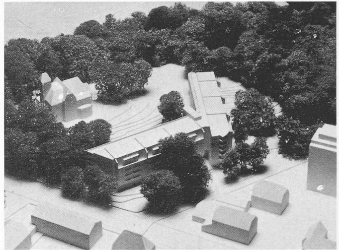
Projekt AAP, Atelier für Architektur und Planung , Bern

Das Projekt hat durch die Überarbeitung eher verloren, der Gürtel der Bauten um die Lichtung erscheint starrer, die bestehende Villa «La Clairière» wird in ihrer dominanten Stellung abgeschwächt.