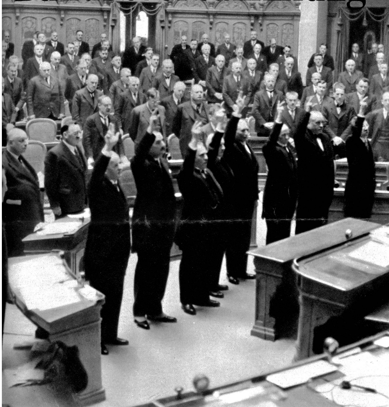
Der Schwur der sieben Bundesräte und des Kanzlers auf die Verfassung

Davon merkt man eigentlich außerhalb dem Bundespalais herzlich wenig. In den heimeligen Lauben Berns begegnet man zwar hin und wieder mal einem oder einem Trüpplein Räte, und der Eingeweihte weiß natürlich sehr gut, wo er zwischen den Sitzungen unsere Landesväter findet, werden doch immer gewisse Lokale und Restaurants bevorzugt. Steckt man aber seine Gwundernase in die Ratsäle hinein, so bekommt man