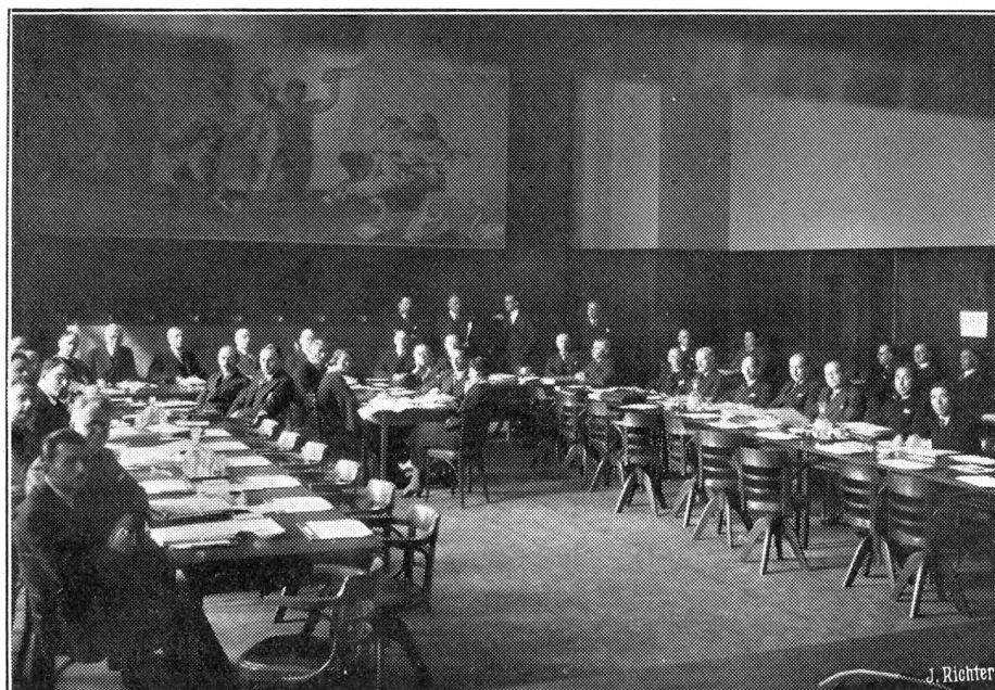
Sitzung der Rohstoffkommission in Genf.