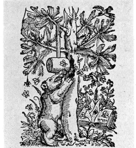
ARGENTORATI APVD MATTHIAM Apiarium. Anno M. D. XXXIII.

In Biel war im Laufe des Februars ein Rückgang der Zahl der Arbeitslosen von 2309 auf 2181 zu verzeichnen.