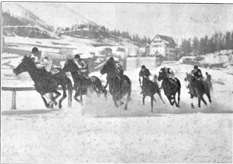
Vor der grossen Rennwoche in St. Moritz.

Es scheint fast, als würden wir wieder ganz in das Zeitalter der Mystik hineinkommen, denn es geschehen derzeit fortwährend ganz miraculöse Dinge, die sich schwer auf natürlichem Wege erklären lassen. So gehen wir z. B. seit Wochen mit Riesenschritten dem Frühling entgegen, ohne daß wir ihm auch nur einen Schritt näher kämen, trotzdem andererseits wieder gar keine Rückschläge in den Winter vorhanden sind. Ähnlich verhält sich die Geschichte mit unserem Franken, der, trotzdem er ein Franken geblieben ist, schon lange keinen Franken mehr wert ist, da sich außer allen anderen Waren sogar der doch auf den abgewerteten Franken zugeschnittene Bundesgugelhopf, das Vollbrot, verteuerte. Und Hitler hielt eine zweistündige Rede, aus der es wirklich schwer werden dürfte, Kriegsdrohungen heraus zu kristallisieren, wenn man nicht etwa die Verneinung der „Kriegsschuldfrage“, bitte Kriegsschuld- nicht Kriegsschuldenfrage, als „casus belli“ bezeichnen will oder am Ende die Erklärung, daß es zwischen Deutschland und Frank-