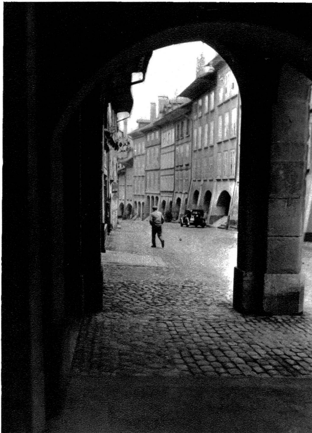
Junkerngasse, Blick stadtabwärts