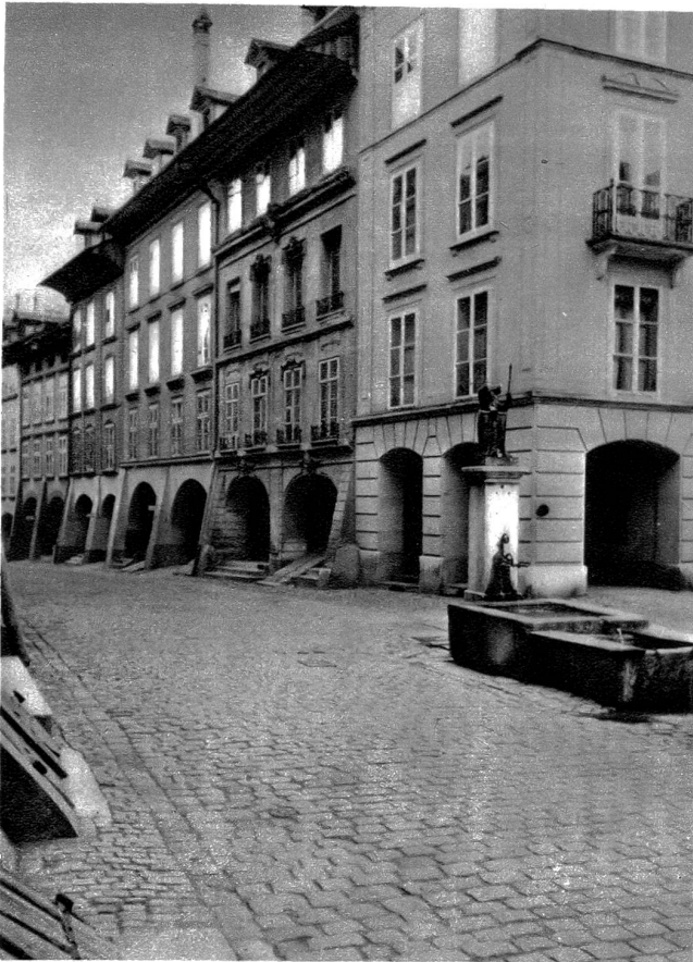
Der Bubenbergrunnen und anschliessende, nordseitige Häuserfront Junkerngasse