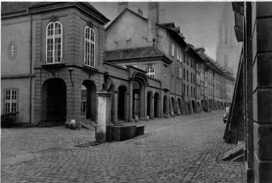
Junkerngasse, vom „Erlacherhof“ stadtaufwärts