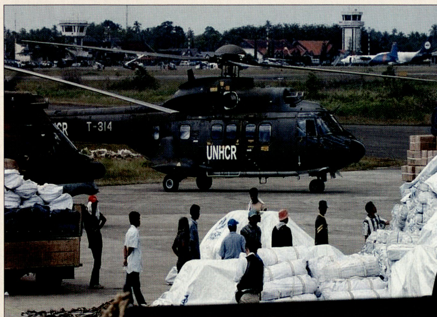
Die Helikopter fliegen im Auftrag des UNHCR.

Mitte Februar erklärte die indonesische Regierung die Phase der Soforthilfe als beendet. Die Vereinbarung mit dem UNHCR legte den 27. Februar als letzten Einsatztag fest. Insgesamt produzierten wir an 42 Flugtagen 477 Flugstunden praktisch ohne technische oder operationelle Probleme und transportierten 370 t Material und 2300 Personen. Nun erfolgte der Rücktransport des Materials (3 Super Puma, 4 Container, 1 Shelter, gesamthaft 45 t Material) wiederum mit 2 AN-124. Am 12. März traf das Gros der Task Force wie-