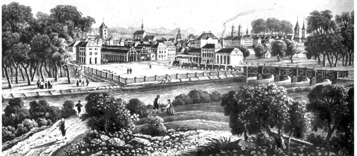
Erster Bahnhof Zürich, aus dem Jahr 1847

der historischen Schweizerbahn hatten noch persönliche Namen, wie „Aare“, Rhein usw. und wurden dadurch jedem Mitreisenden gut vertraut. Die erste Lokomotive „Aare“ war von dem Basler Techniker Nikolaus Riggerbach, dem späteren Erbauer der Rigibahn, auf einem Wagen über die Basler Rheinbrücke und nach Zürich geführt worden, zur größten Freude aller Zuschauer in den Städten und Dörfern. Die ursprünglich geplante Weiterführung der Bahn von Baden über Klingnau nach Waldshut ins Deutsche ist nie zustande gekommen, sondern die