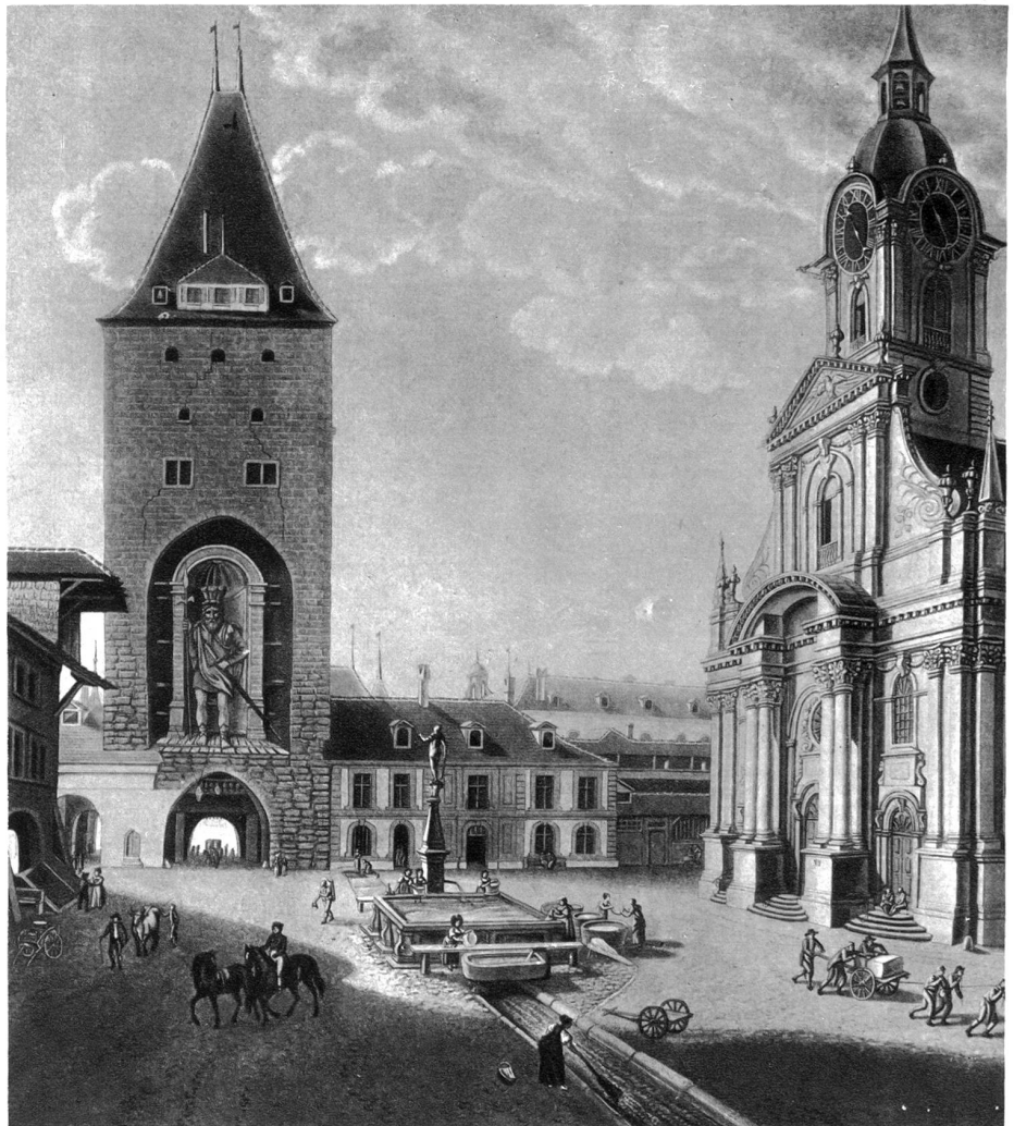
Christoffelturm von der Spitalgasse aus gesehen. Auf der Seite gegen die Heiliggeist-kirche sind noch die alten Stadtmauern zu sehen. Vorn der Davidsbrunnen. Die Heilig-geistkirche erscheint auf diesem Bilde in ihrer ganzen Schönheit