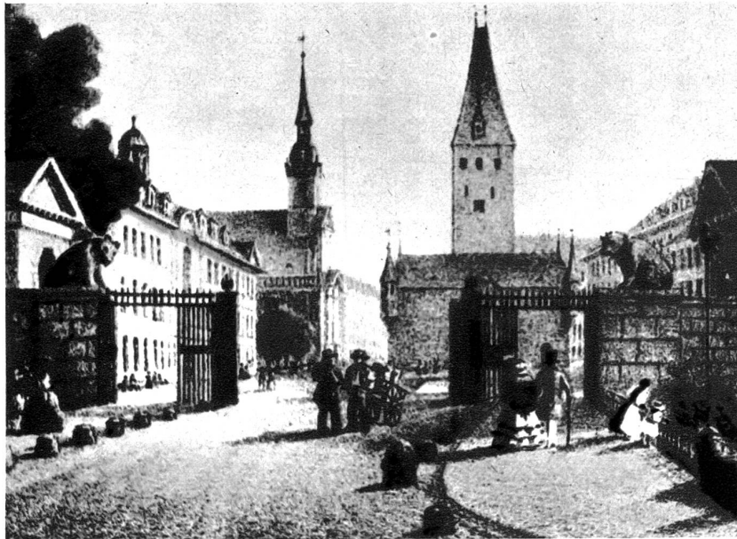
Murten- oder Oberes Tor. Gittertore schliessen die Stadt ab, Granitbären bewachen den Stadtzugang

und in den Garten des Rädereggengutes in der Schoßhalde gestellt.