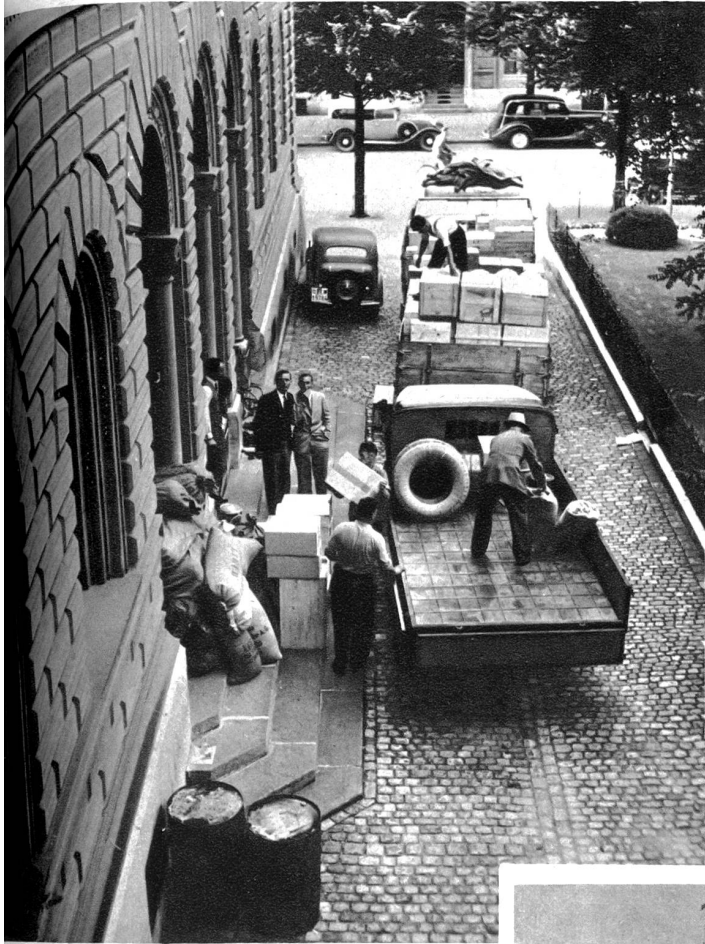
Vor dem Bundeshaus werden die Wagen mit den nötigen Lebensmitteln beladen

war das Haupttor der dritten Befestigungslinie. Das genaue Datum seiner Erbauung ist nicht bestimmt: es dürfte das Jahr 1346 oder 1347 sein. Der ursprünglich kaum über die Stadtmauer ragende Turm wurde 1467 in Tuffquadersteinen auf die stattliche Höhe von 55 Metern, bis zum Dachfirst gemessen, gebracht. Auf 4,5 bis 6 Meter Entfernung vom Turm standen dreiseitig nach außen die Mauern des Vorwerks, das den Turmfuß schützen und die Verteidigungs-vorrichtung des Tores verstärken sollte. Unter seinem Gewölbe konnte der Zugang durch Fallgatter und Tor abgeschlossen werden, während unter dem Turm selbst ein Fallgatter und andere Tore doppelten und dreifachen Verschluss boten. Der Christoffelturm wurde auch der Oberspitalturm benannt nach dem Heiliggeistspital, das sich in seiner Nähe befand. Gegen die Spitalgasse, also gegen die innere Stadt zu, war der Turm offen, wie dies bei mittelalterlichen Türmen öfters der Fall war. In seine große Nische wurde 1496 die weniger künstlerische denn kolossale Holzstatue des heiligen