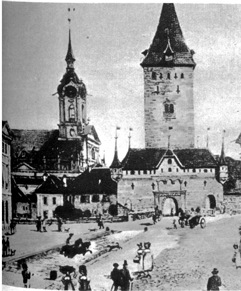
Christoffelturm, von der Seite des Burger-spitals aus