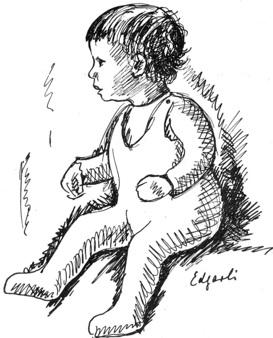
Federzeichnung Edgar Brügger, Bern

Heute hat ein Jüngling Gelegenheit, eine Graphikerlehre zu absolvieren, welche durch entsprechende Kurse und Stunden