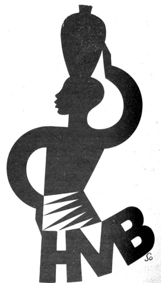
Markenzeichen H. Sollberger, Bern