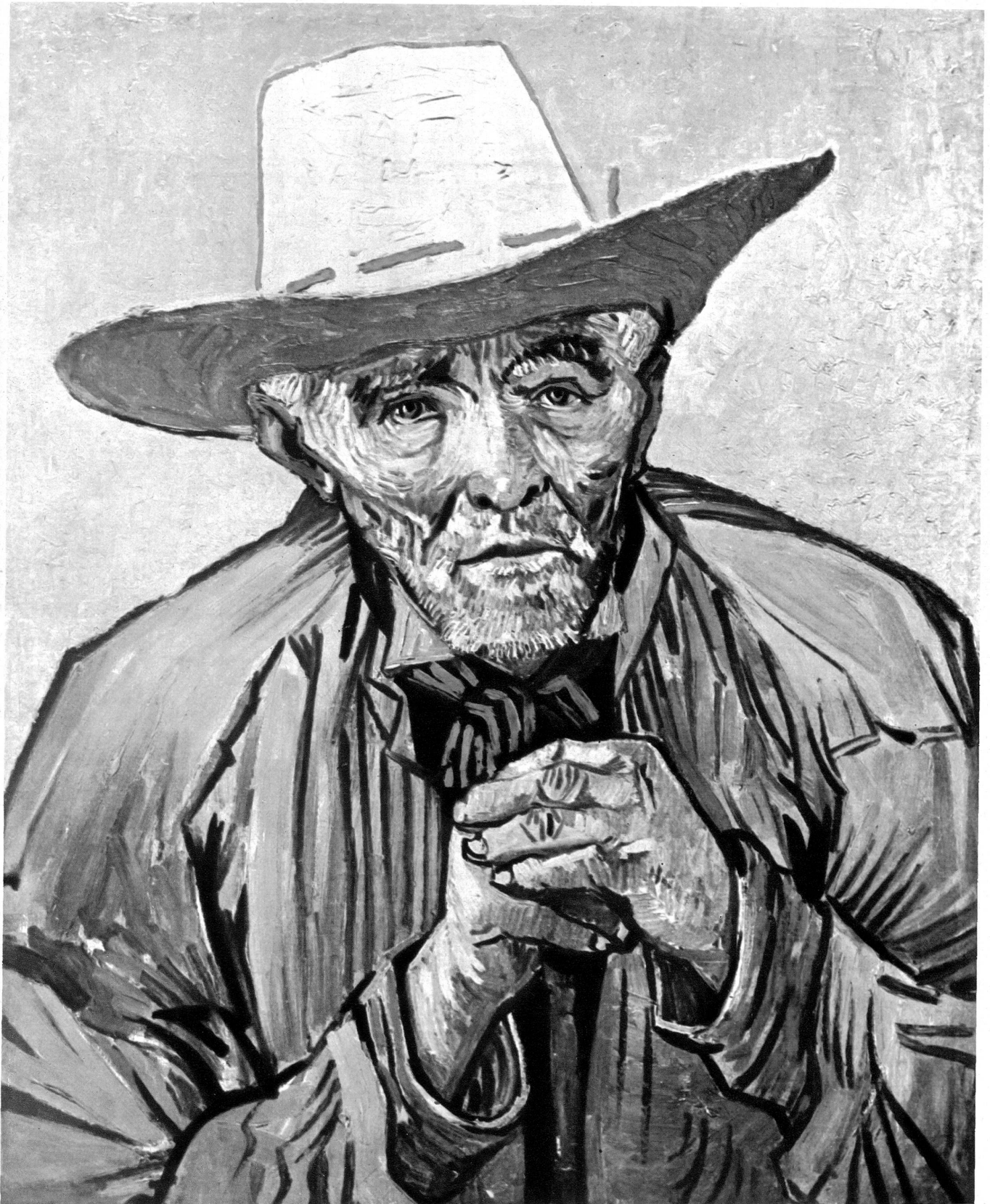
Vincent van Gogh. Der Bauer.

Reproduktion aus der Kunsthandlung Christen