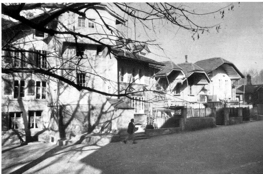
Häuserreihe des Nydegghöflis, die auf Mauern der alten Burg errichtet sind.

Die Seite des Nydegghöflis, die sich dem Stalden entlang zieht, hat gleichfalls Eingänge, die durch das ganze Haus hindurch gehen und am Stalden ausmünden. Zum Interessantesten gehört das Bäckerhaus mit seinem fröhlichen Erker, das