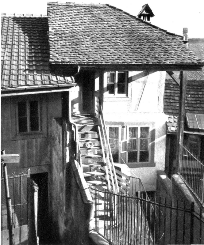
Treppe zum Zimmer der Zähringerfräulein