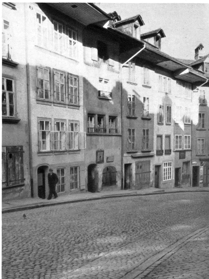
Häuser am Stalden, Sonnseite. Das Haus mit den kleinen Fenstern und dem halbrunden Schaufenster war das älteste Salzhaus