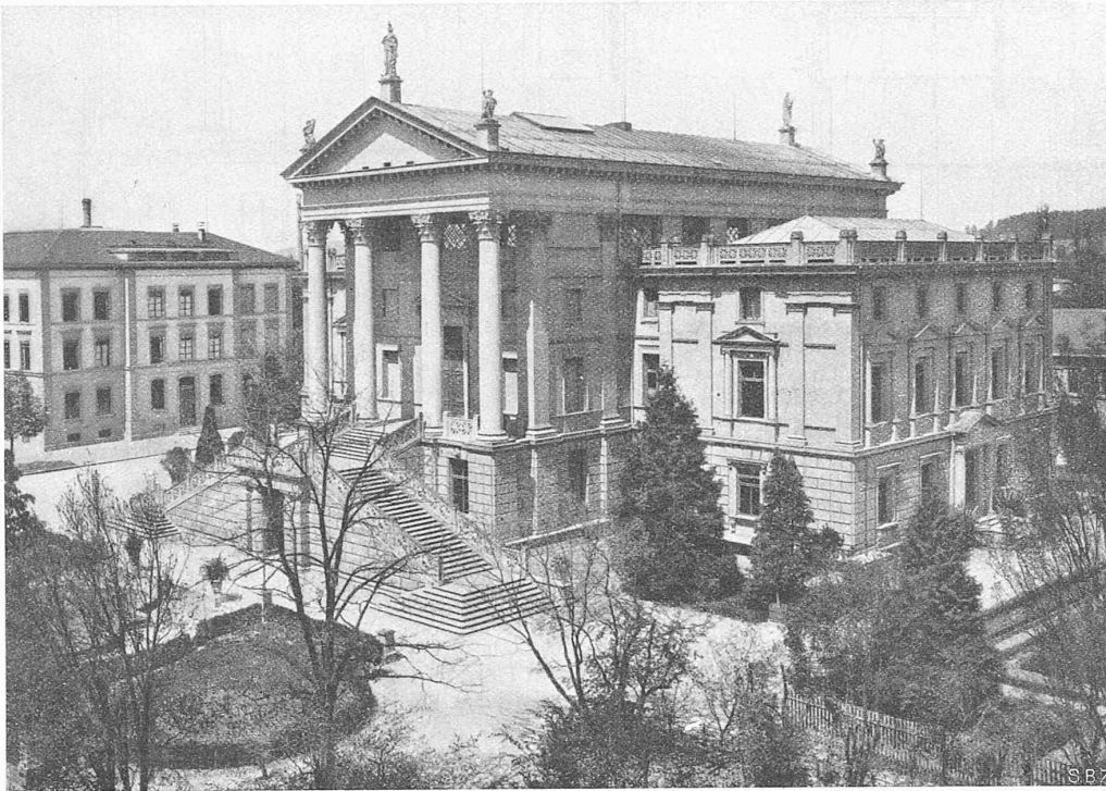
Abb. 2. Das Stadthaus Winterthur, erbaut 1866 bis 1869 nach Plänen von Gottfried Semper.