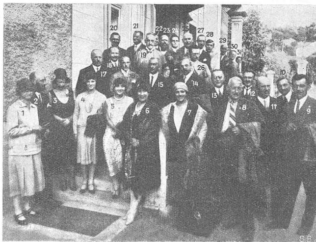
Le vendredi 4 octobre, à la Sté. Savoissienne, Aix-les-Bains.

Le vendredi, sous un ciel d'un bleu méditerranéen, un autocar nous emmena, par une route franchissant défilés et cols pittoresques, jusqu'à Aix-les-Bains où la Sté Savoissienne de Constructions Electriques nous accueillit avec sa cordialité coutumière et nous fit visiter ses ateliers où elle construit des transformateurs. Des paroles pleines de bonne