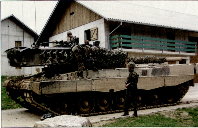
Ortskampfanlage Nalé eingenommen! Die Pz Gren Log Kp 20 liefert in der Gefechtspause Betriebsstoff für die Kampfpanzer.