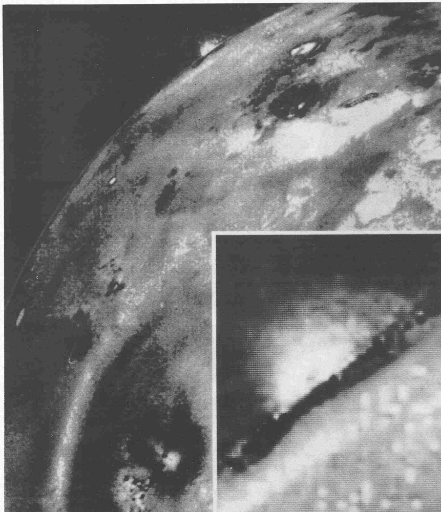
Ungestümer Vulkanausbruch auf dem Jupiter-Mond Io: Diese von Voyager 1 aus ungefähr 490 000 Kilometer Abstand gemachte Aufnahme zeigt am Horizont Ios einen explosionsartigen Vulkan-Ausbruch. Dabei wird feste Materie bis in 160 Kilometer Höhe geschleudert (innerer Bildausschnitt). Dies erfordert Auswurfgeschwindigkeiten von schätzungsweise 1920 Kilometer pro Stunde

Der wichtigste Grund: Die im Ring beobachteten Teilchen sind mit durchschnittlich 1 Mikrometer nicht nur ungefähr zehn- bis hundertmal grösser als die Io-Partikel, sie haben auch ganz andere Eigenschaften. Zum Beispiel lassen sie sich, im Gegensatz zu den Io-Teilchen, vom starken Magnetfeld Jupiters nicht beeinflussen, dazu sind sie zu schwer. Statt dessen bestimmen die Anziehungskraft des Riesenplaneten und der Strahlungsdruck des Sonnenlichts das Schicksal der Ring-Partikel. Unter diesen Einflüssen bewegen sie sich auf Spiralbahnen langsam auf den Riesenplaneten zu. «Spätestens nach 10 000 Jahren», so rechnet Dr. Morfill, «wären alle Ring-Teilchen in die turbulente Gashölle Jupiters eingetaucht