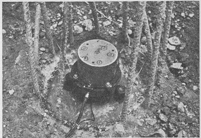
Vibrationsmethode: Vibrator und Beschleunigungsmesser

Durch kontinuierliche Registrierung der mechanischen Impedanz in einem gewissen Frequenzbereich lassen sich die oben geschilderten Fehlstellen oder Materialmängel feststellen. Die