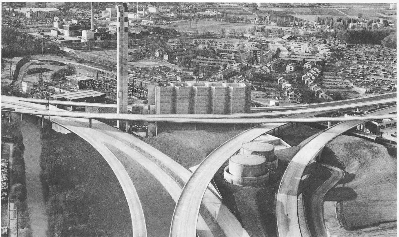
Bild 5. Luftaufnahme. Die Strassentrasses sind hineinmontiert