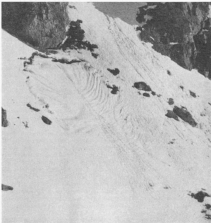
Bild 1. Beginn der Lawinenbildung in Nass-Schnee: Kriechen — Abriss — Laminares Fliessen. Mittelgrat ob Davos