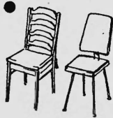
Grosse Auswahl an bequemen Stühlen, mit oder ohne Polster

Wichtig ist die freundliche, gelöste Atmosphäre - der ansprechende Raum, der verbindende Tisch, der Stuhl, auf dem man entspannt und komfortabel sitzt. Unsere gepflegte Auswahl an Einrichtungen für Empfangs- und Konferenzzimmer könnte Ihnen helfen, die richtige Atmosphäre zu treffen. Sie finden: Ausgewogene Sitzungstische für vier, sechs, zwölf und mehr Gesprächspartner - neuzeitlich geformt oder stilvoll und klassisch; bequeme, einladende Polsterfauteuils mit aperten Wollstoff- oder Lederbezügen; dazu die passenden Telefonboys, die Kredenzen für Akten oder Muster. Lassen Sie sich das vielseitige Sortiment in unserer Ausstellung zeigen. Wir schicken Ihnen auch gerne den neuen Katalog und unterbreiten individuelle Vorschläge. Unser Telefon: 051/271555.