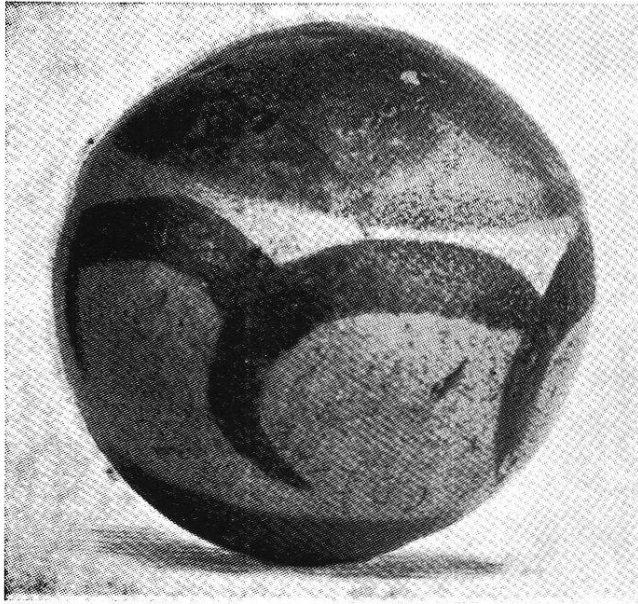
Der Luzerner Drachenstein. ( Draconites lucernensis .) (Originalaufnahme, verkleinert. Naturhistorisches Museum Luzern.)