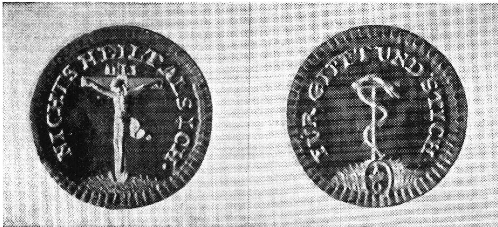
Pestdukatens (in Gold, \frac{1}{6} Dukaten, vergrößert.)

Avers: Um den Crucificus die Legende: „Nichts heilt als ich.“