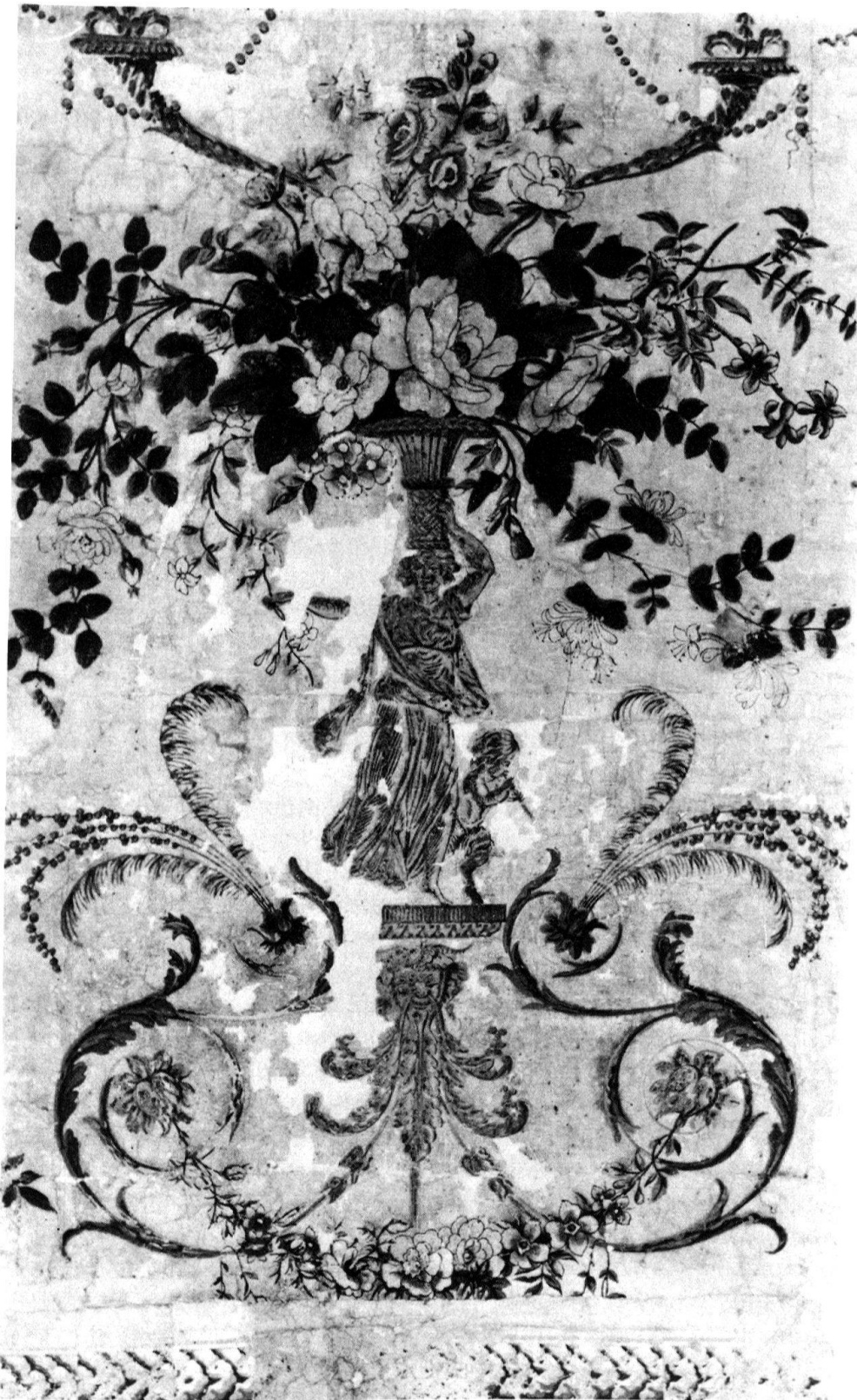
2 Domino, France, vers 1770, attribué par N. McClelland au domino-tier parisien Basset, Musée du papier peint, Rixheim. Ce domino a été retrouvé, avec plusieurs autres du même type, sous un panneau de Réveillon, utilisé en paravent. Il a été séparé du papier le recouvrant par trempage. Travail réalisé dans l'atelier de restauration du musée.

parfois obliger à des choix difficiles quand ces dernières ont une importance historique et s'avèrent impossible à enlever sans les détériorer). La colle de ruban adhésif s'élimine au solvant, dans la mesure du possible, mais laisse en place des traces de brûlure.